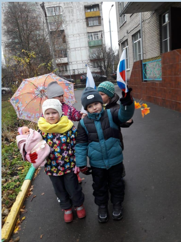
На параде в день народного единства.