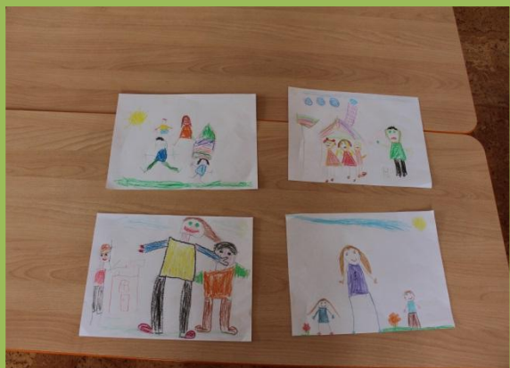
Рисование «Моя счастливая семья»