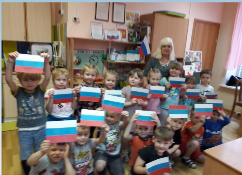
аппликация «Флаг нашей родины»