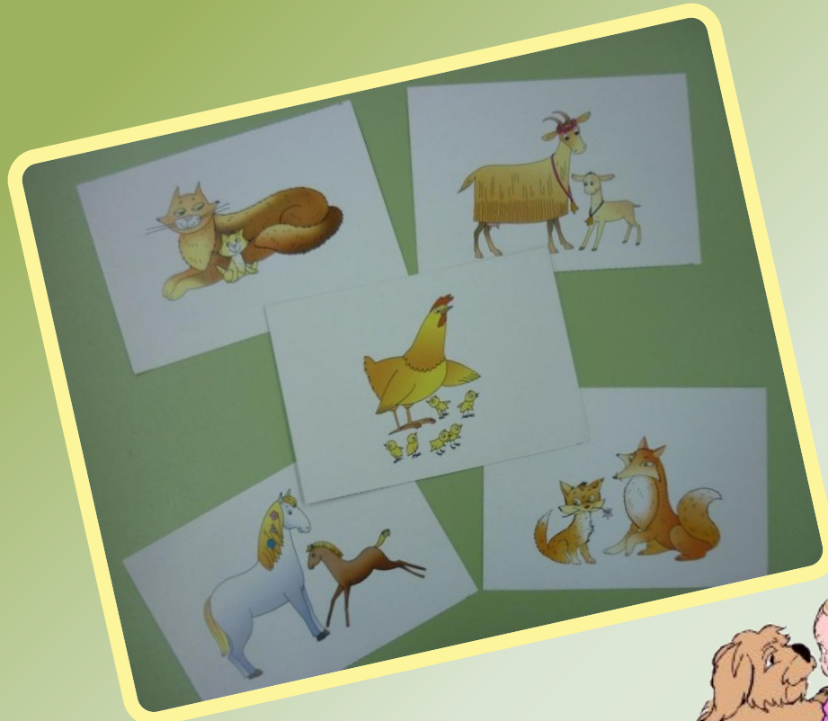
«Мама и детки»

Коммуникативная и познавательно – исследовательская деятельность Беседа. Ситуативный разговор. Наблюдения. Отгадывание загадок