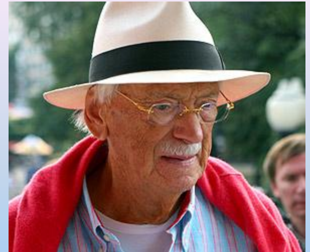
Именем Михалкова названа одна из малых планет Солнечной Системы (1999).