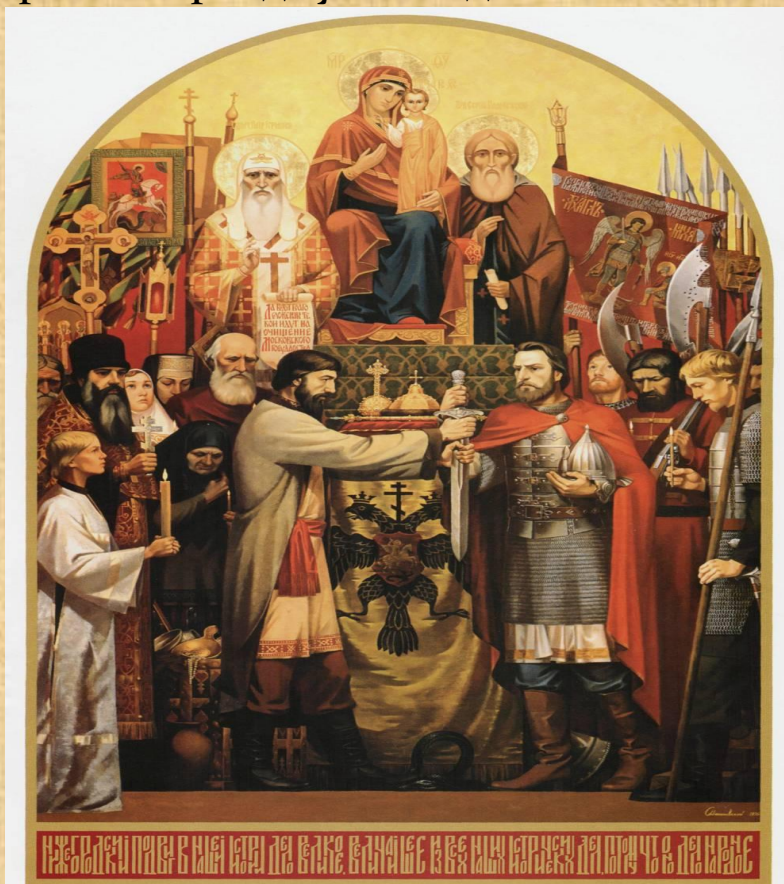
-НИЖЕГОРОДСКИЙ ПОДВИГ. 1611 ГОД-

Главной святыней Нижегородского ополчения была икона Казанской Божьей Матери. С ней оно и двинулось на Москву. Вот почему день народного единства и праздник Казанской Божьей матери мы празднуем в 1 день.