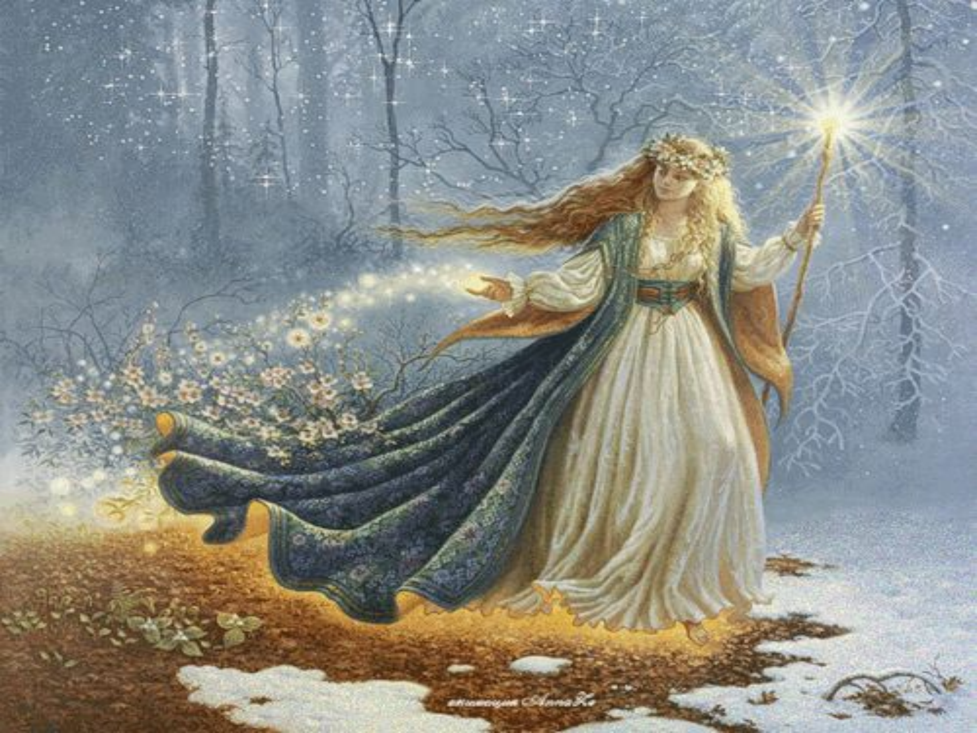
Иллюстрация © Анна К.