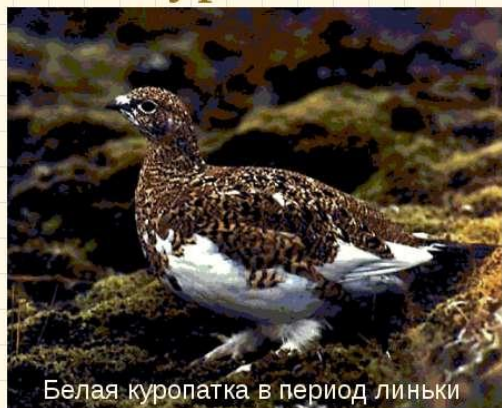
Белая куропатка в период линьки

КУРОПАТКИ, несколько видов птиц семейства тетеревиных и фазановых. Тундряная и белая куропатки обитают в тундре, серая и бородатая куропатки — в лесостепи и степи, кеклик — в среднем поясе гор.