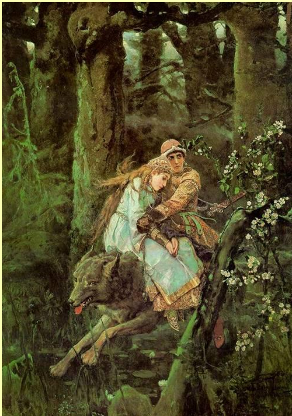
Иван-царевич на сером волке