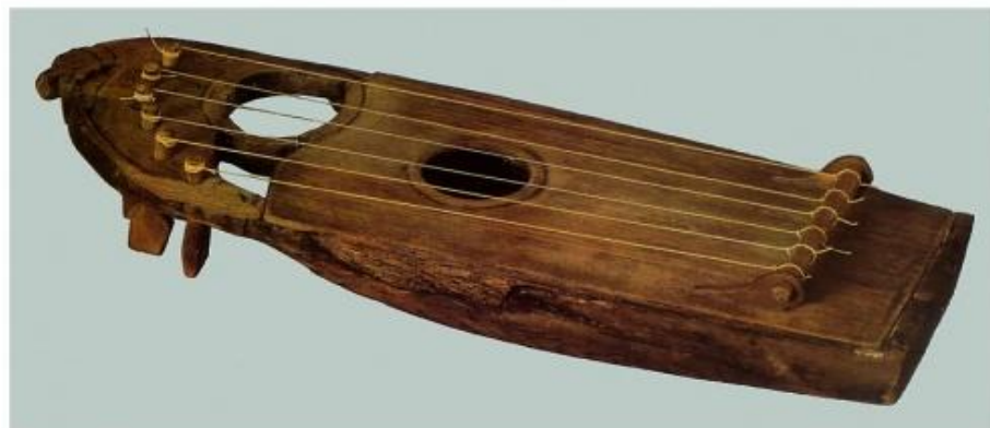
Гузли шестиструнные. Дерево. Длина 35,3 см. Первая половина XII в.