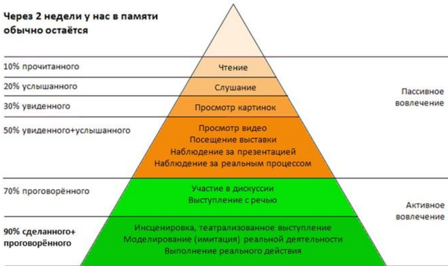
Конус обучения (Эдгар Дейл)

Через 2 недели у нас в памяти обычно остаётся