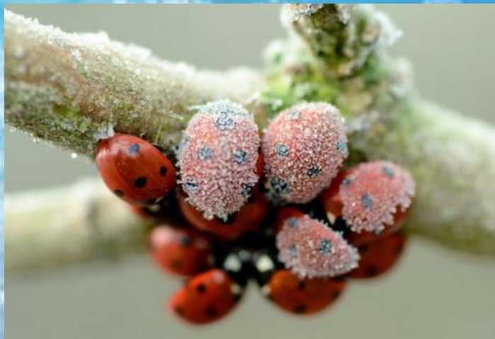
В компании зимовать теплее