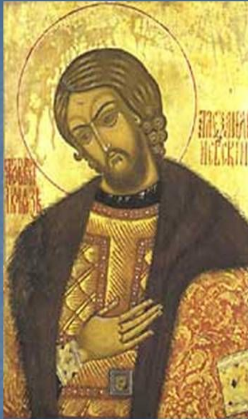
Икона святого благоверного князя Александра Невского