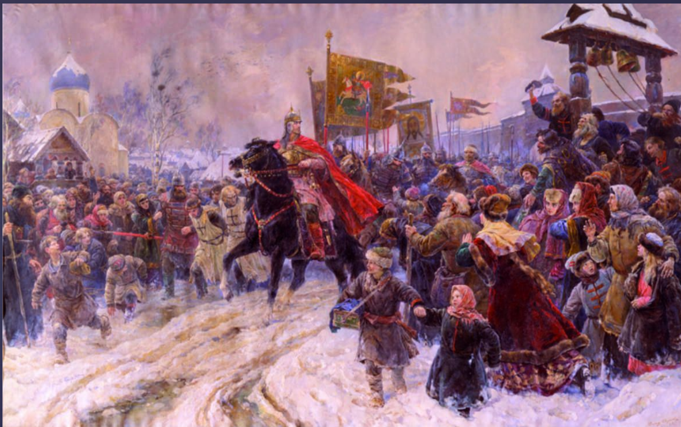
Встреча Новгородцев дружины Александра Невского