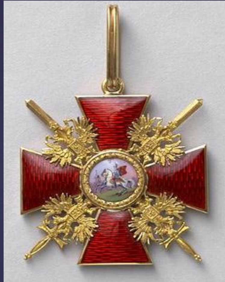
Орден святого Александра Невского I степени