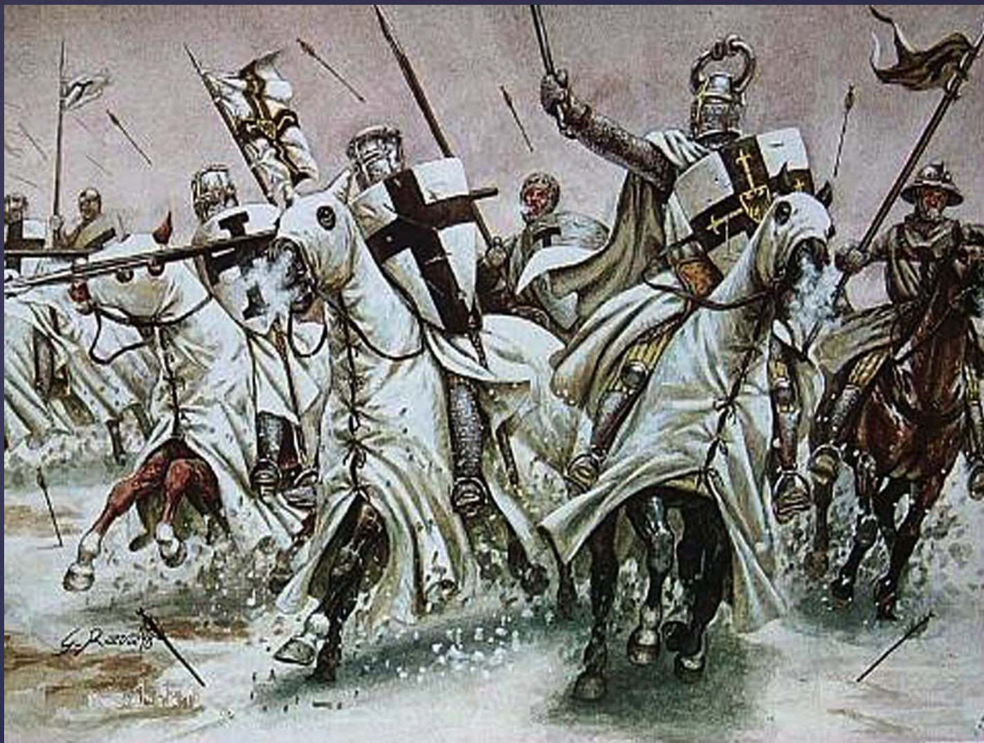
Атака немецких рыцарей