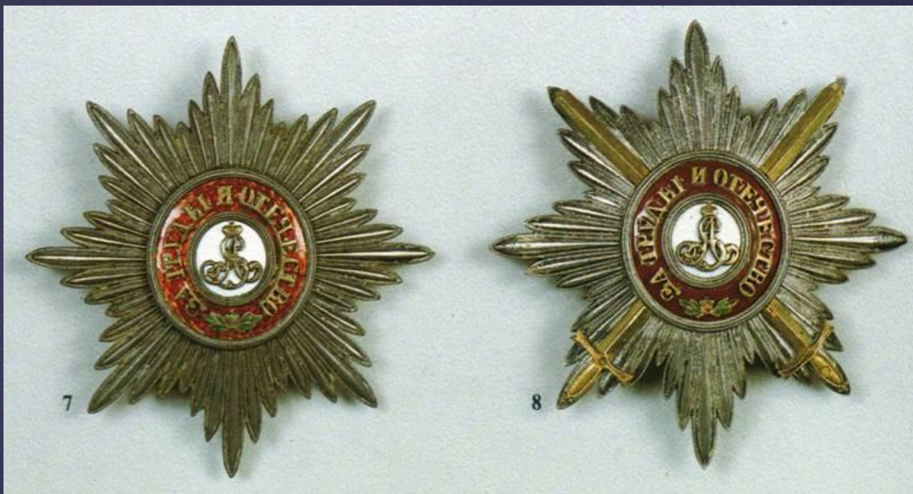
Орден святого Александра Невского - 19 век.