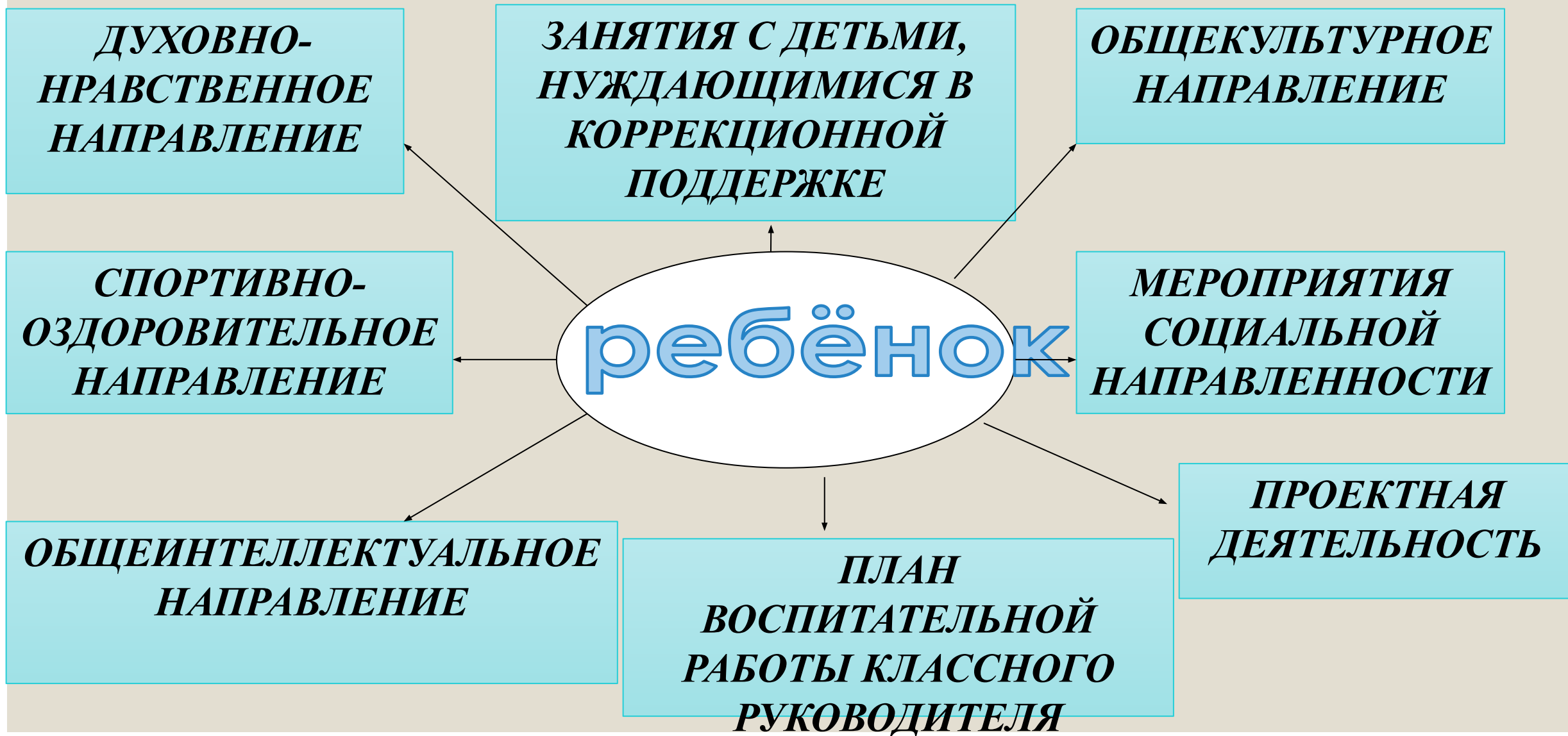
Схема внеклассной работы.