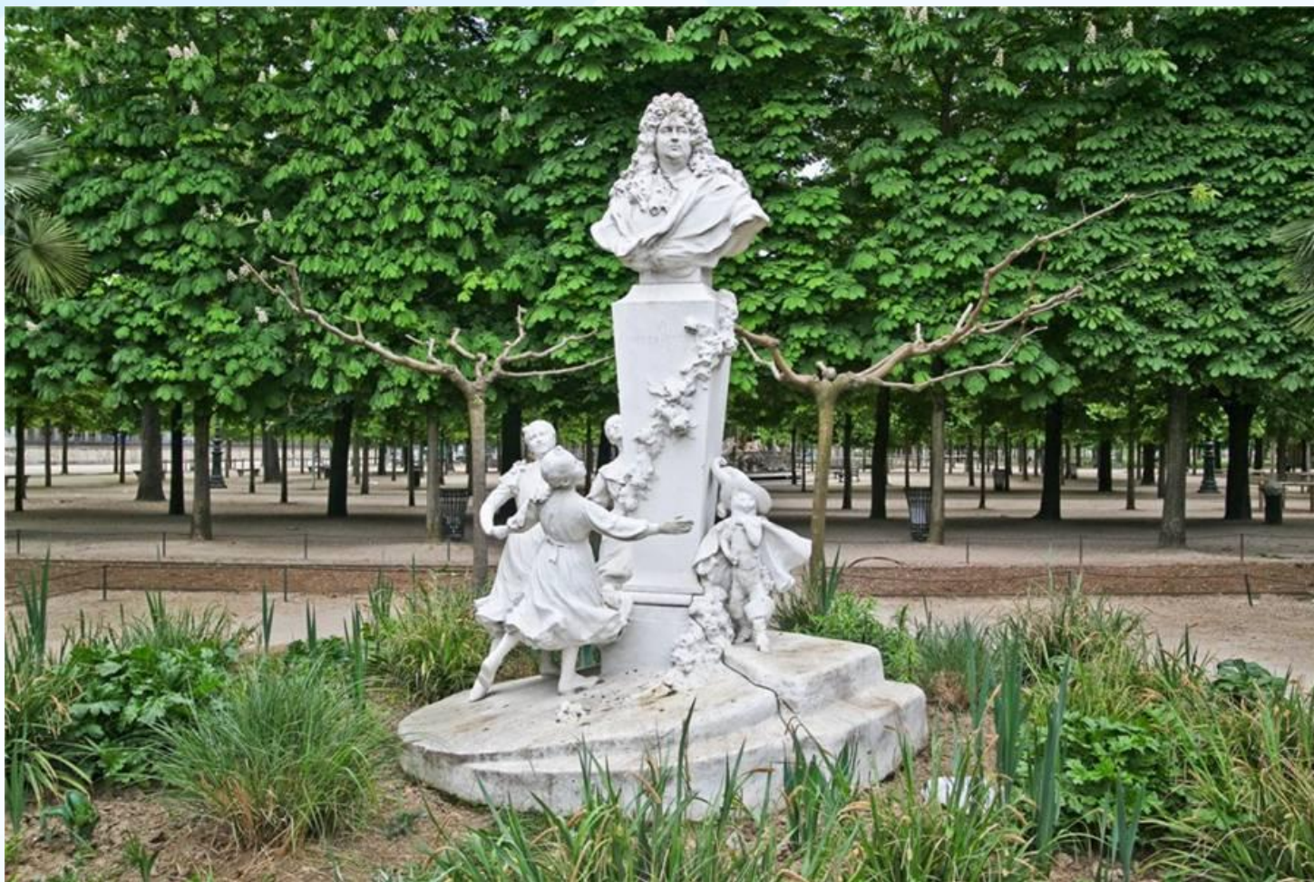
Париж. Сад Тюильри. Памятник Шарлю Перро