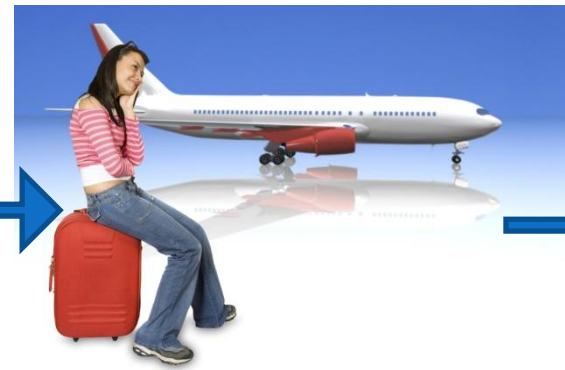
Схема сюжетной ЛИНИ