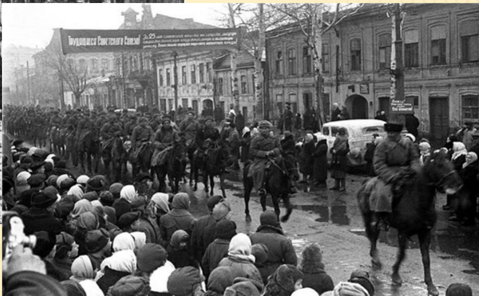
В город входят части Красной Армии