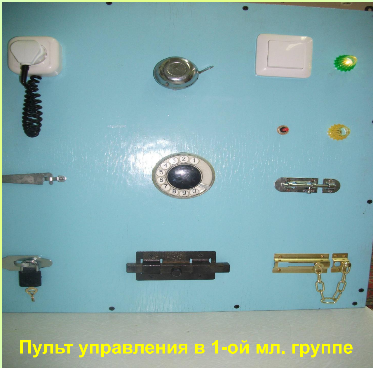
Пульт управления в 1-ой мл. группе