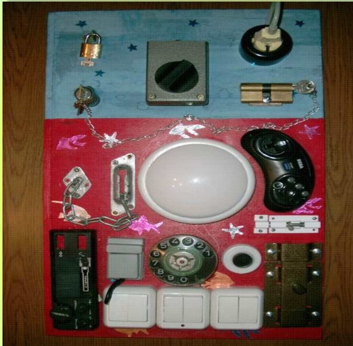
Образец пульта управления