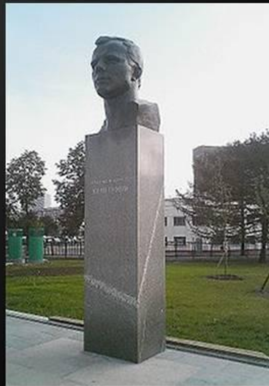
Памятник Юрию Гагарину на аллее Космонавтов в Москве

Имя Гагарина носят учебные заведения, улицы и площади многих городов мира. Именем Гагарина назван кратер на обратной стороне Луны.