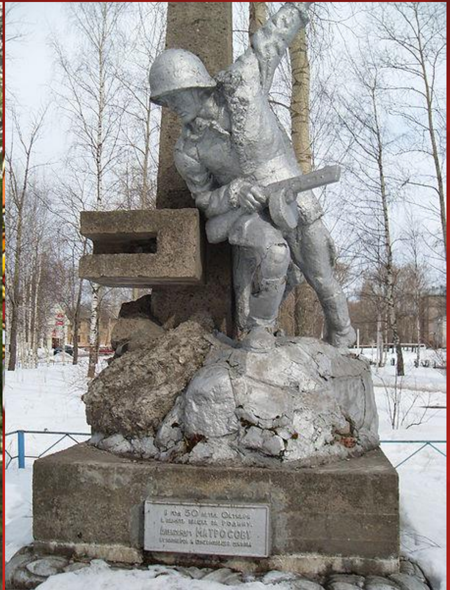
А, так выглядят памятники Александру Матросову в других городах России