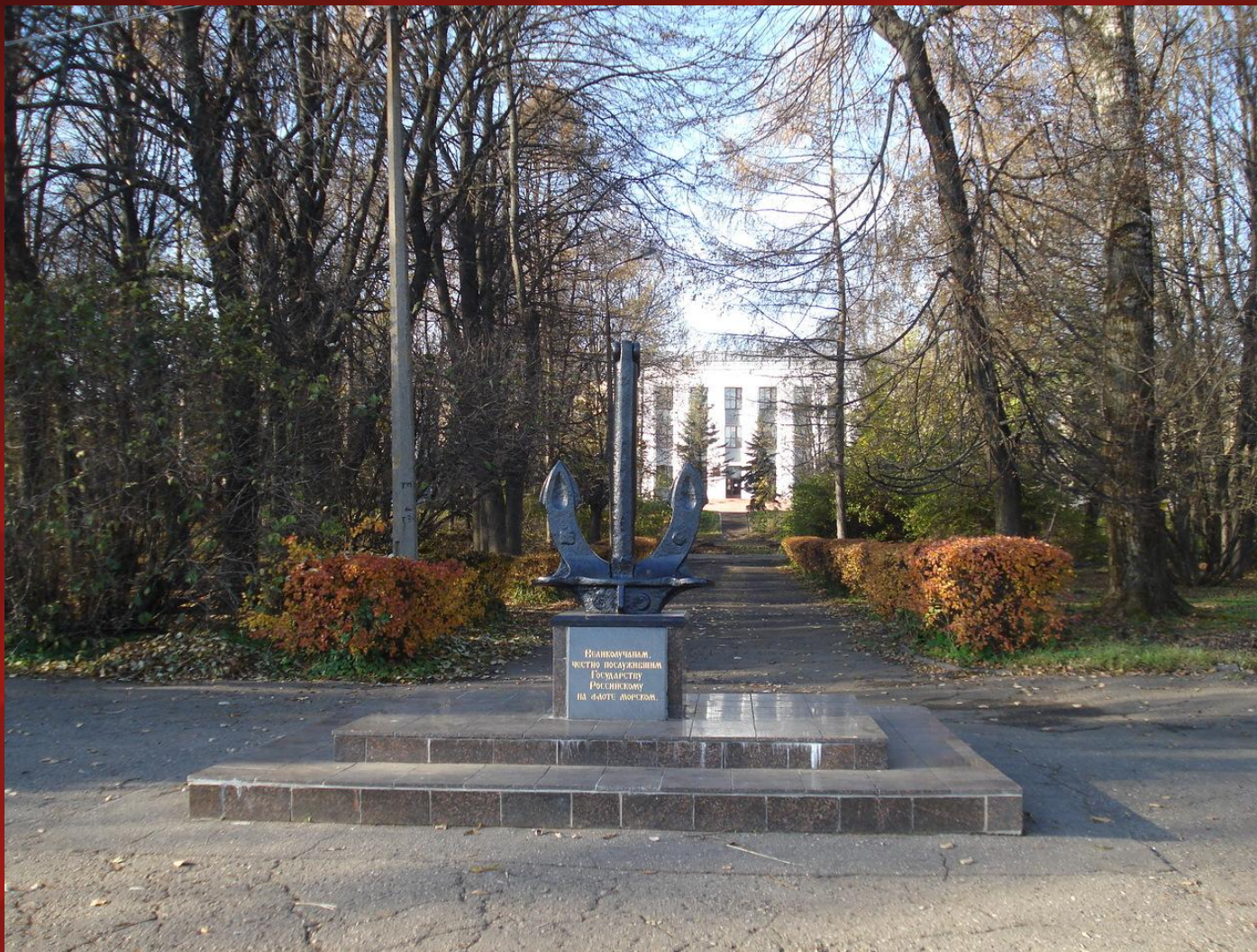
Памятник великолучанам, честно послужившим Государству Российскому на флоте морском. Установлен на левом берегу Ловати