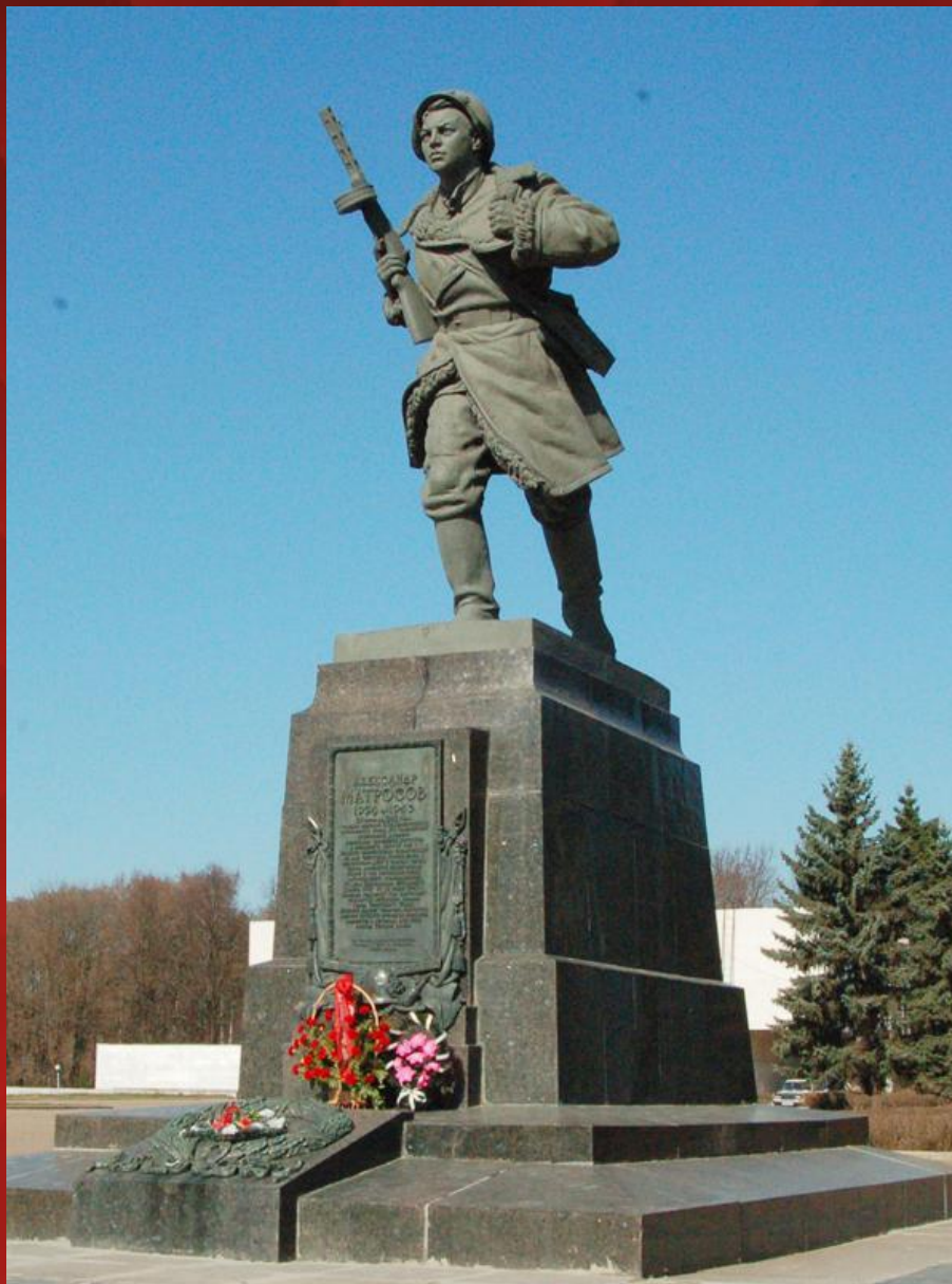
Памятник Александру Матросову