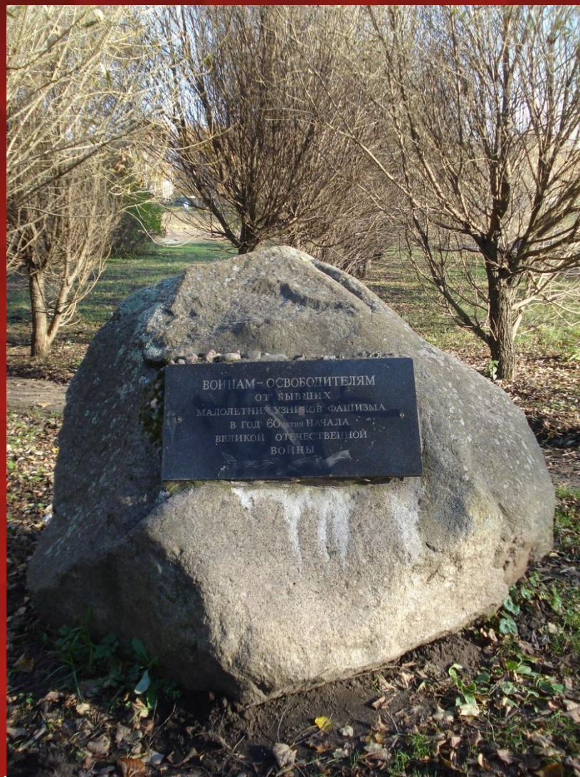
Памятный знак воинам-освободителям от малолетних узников фашизма. Установлен в 2005 году