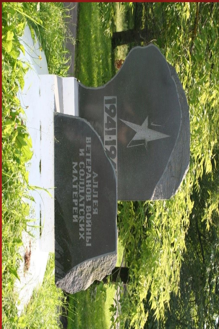
Памятный знак «Аллея солдатских матерей»