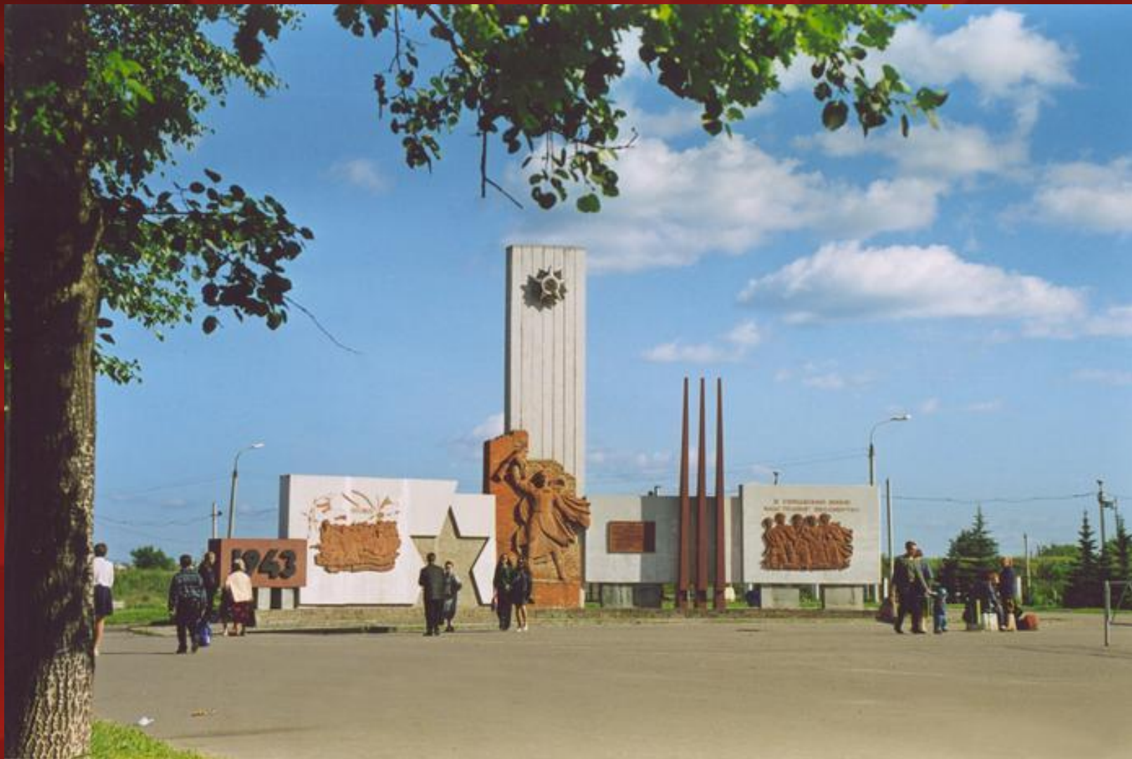
Памятный знак в честь 40-летия освобождения города