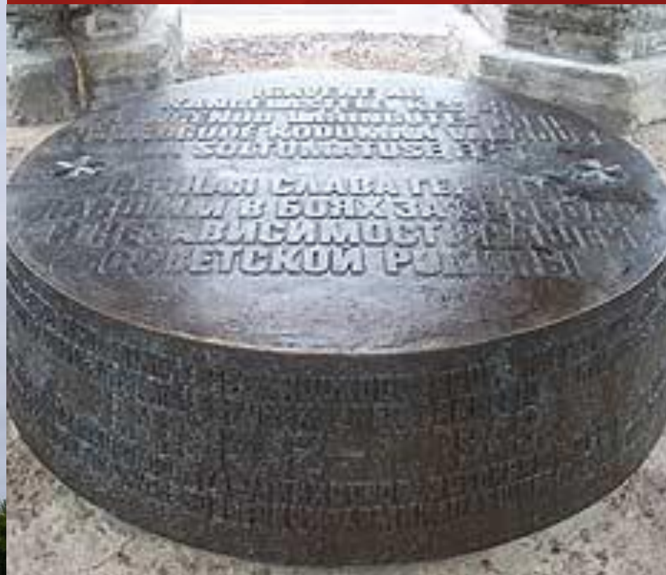
Памятник эстонским солдатам