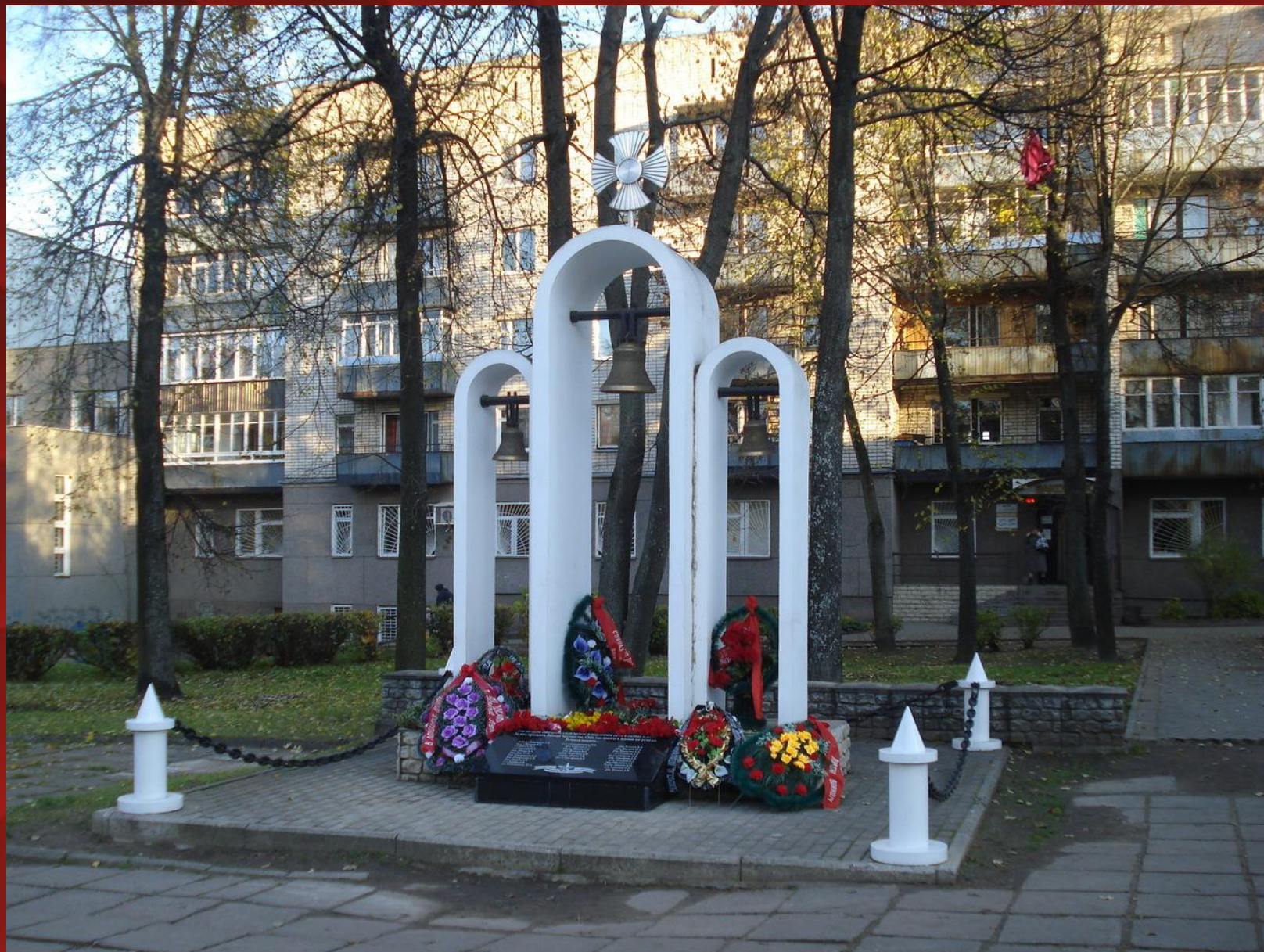
Памятный знак воинам — великолучанам, погибшим в мирное время в горячих точках, установлен в 2005 г