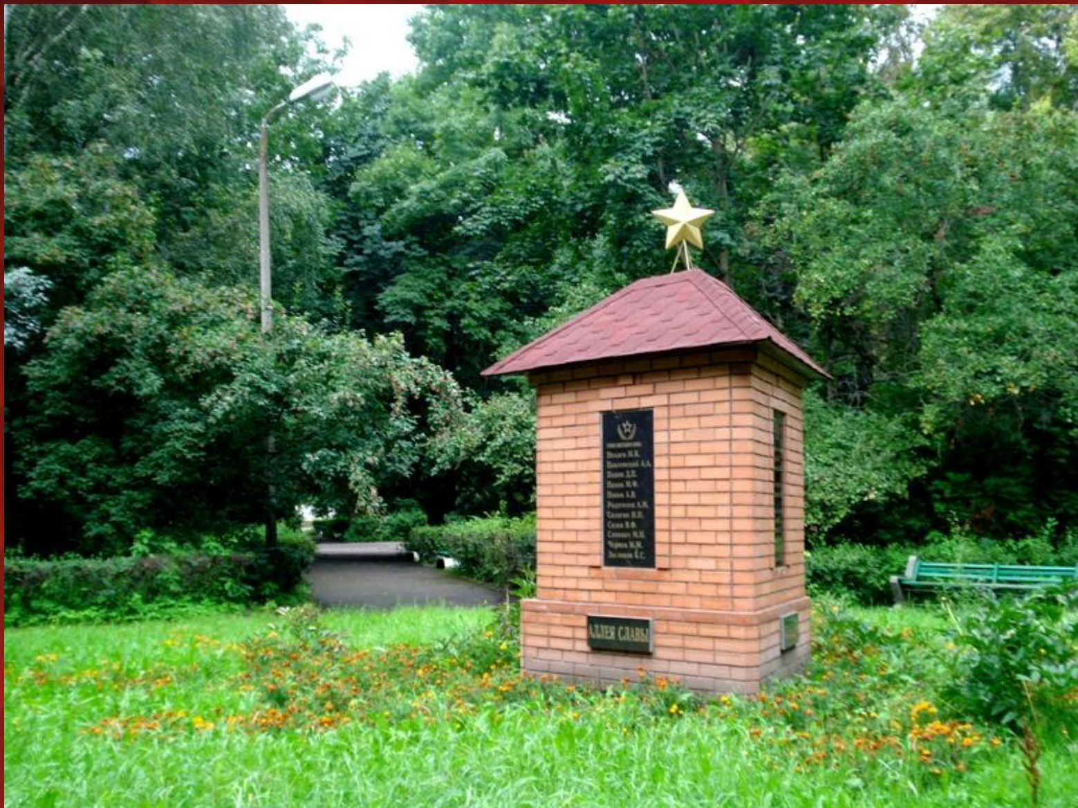
Памятная стела с именами Героев Советского Союза и Героев труда, уроженцев Великих Лук и людей, чья жизнь тесно связана с городом и районом