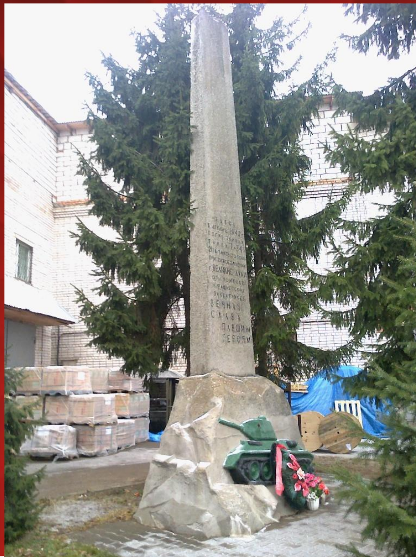
Обелиск-памятник экипажу танка Т-34 21 гвардейского танкового полка