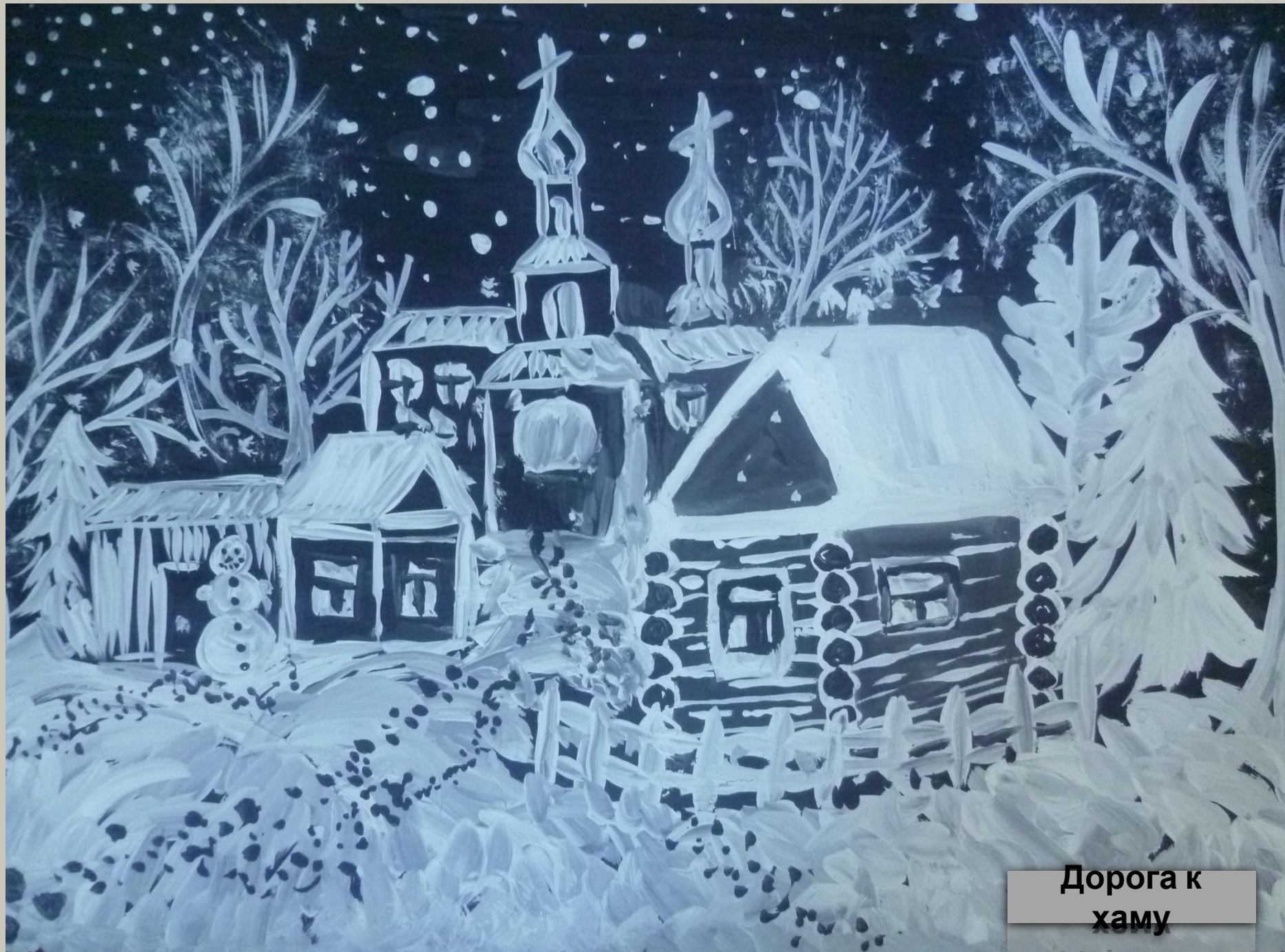
Дорога к хаму