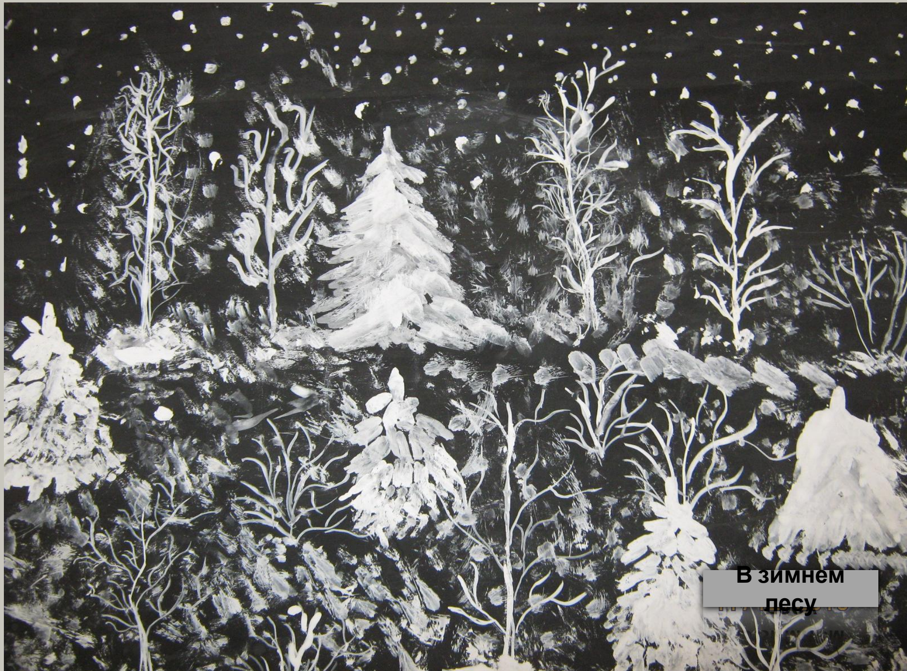
В зимнем лесу