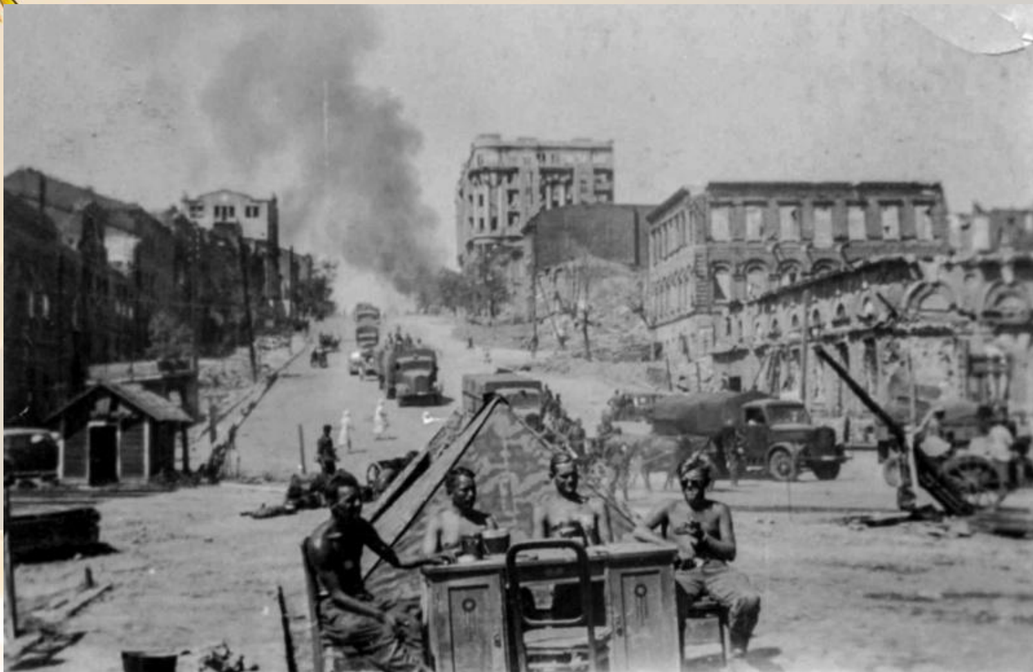
Немецкие солдаты за столом у палатки на Буденновском проспекте в Ростове-на-Дону