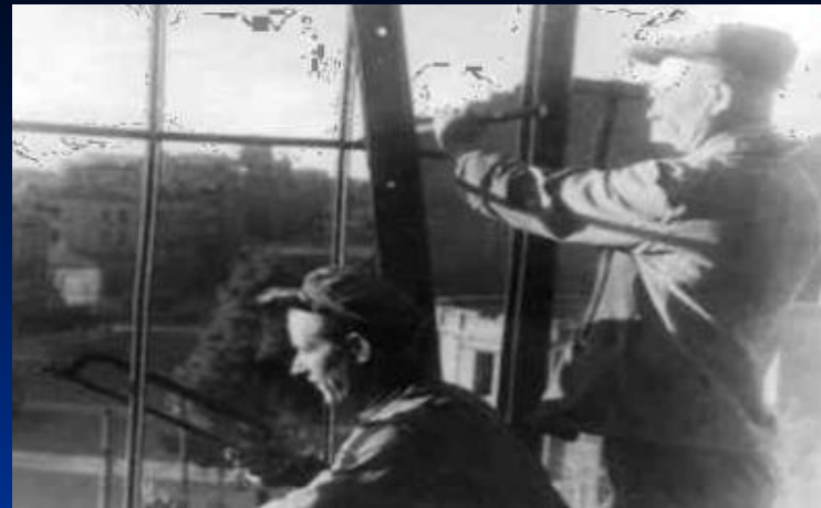
Ростов-на--Дону. 1945 год.