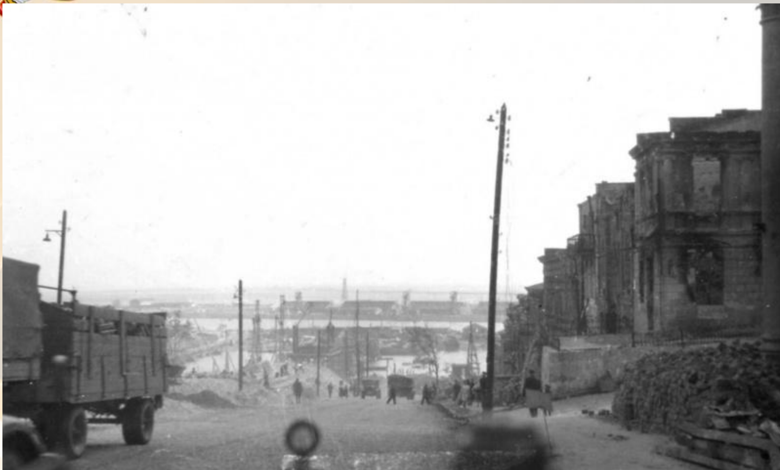
Вид на улицу и разрушенные дома в оккупированном Ростове-на- Дону