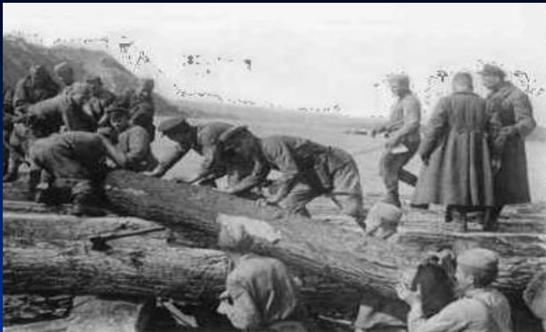
Возведение моста через Дон. 1942 г.