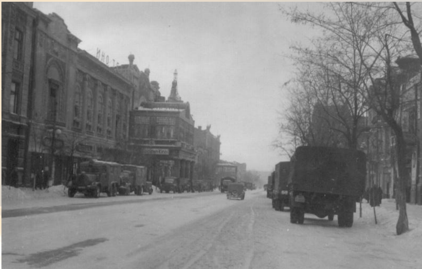
Центральная улица Ростова-на-Дону в период оккупации