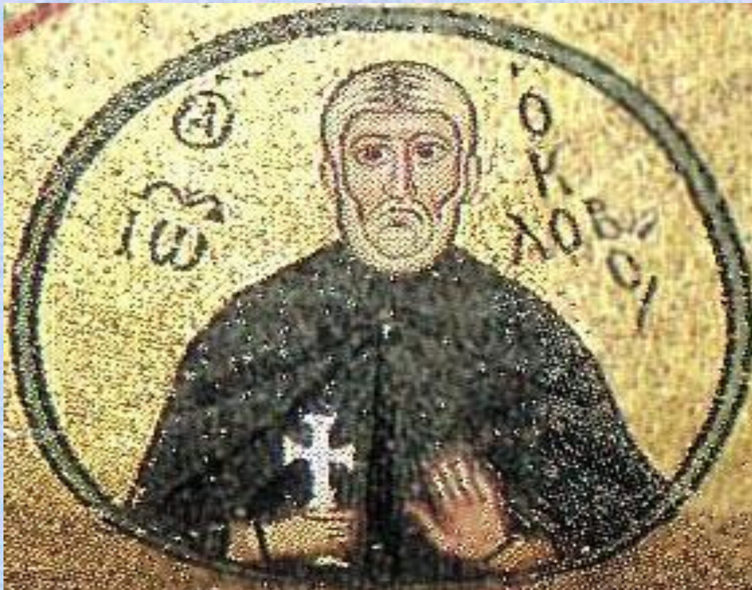
Авва Иоанн Колов