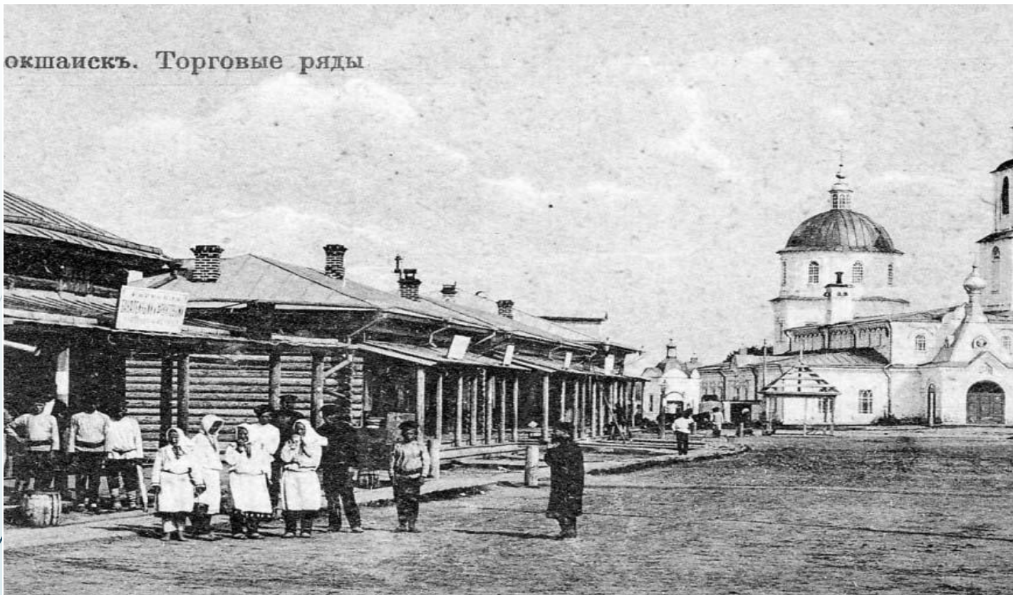
Окшайскъ. Торговые ряды

В связи с этим грандиозным событием молодая Марийская автономная область получила выход на общую железнодорожную сеть страны, что явилось большим шагом к развитию промышленности региона.