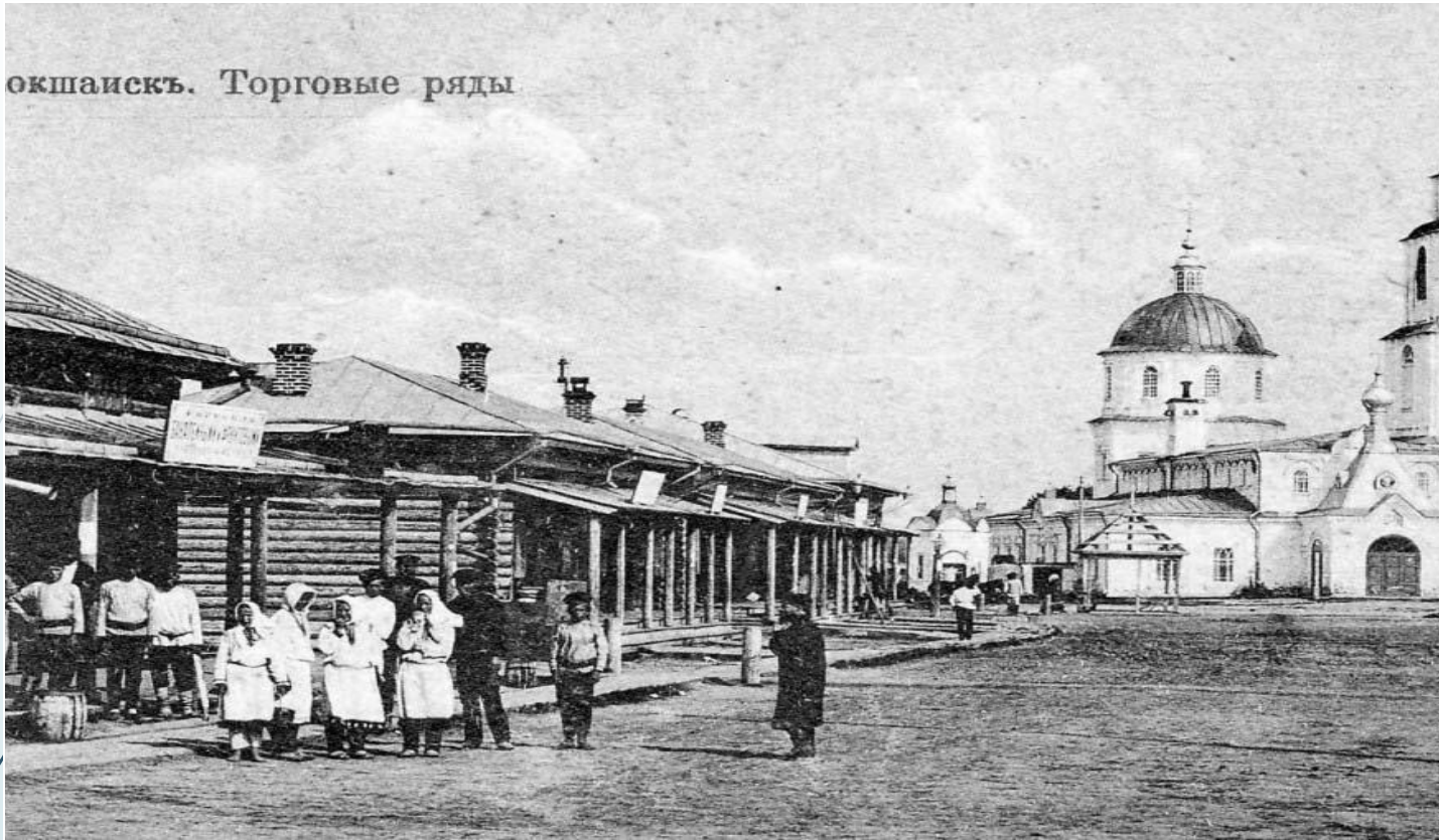
окшаискъ. Торговые ряды

В связи с этим грандиозным событием молодая Марийская автономная область получила выход на общую железнодорожную сеть страны, что явилось большим шагом к развитию промышленности региона.