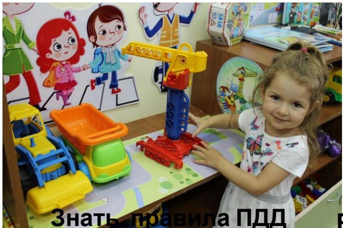
Знать правила ПДД