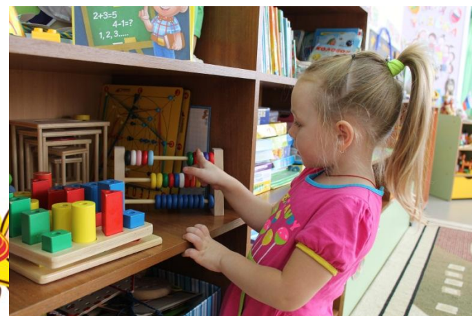
Считать до 5, сравнивать