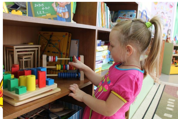
Считать до 5, сравнивать