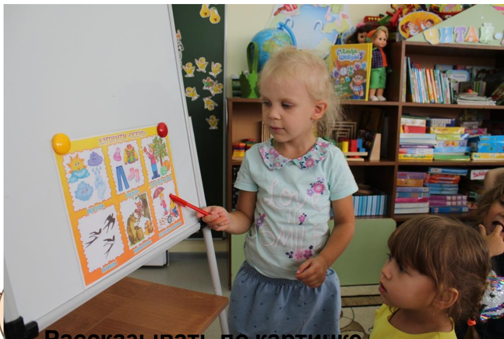
Рассказывать по картинке