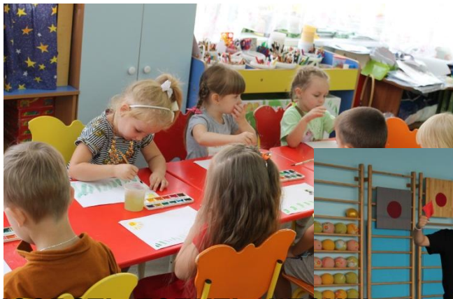
Рисовать, лепить, клеить