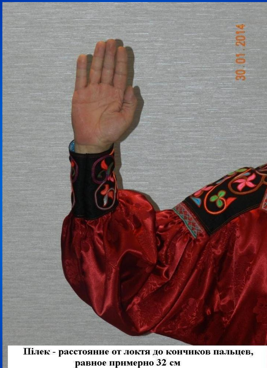
Шілек - расстояние от локтя до кончиков пальцев, равное примерно 32 см