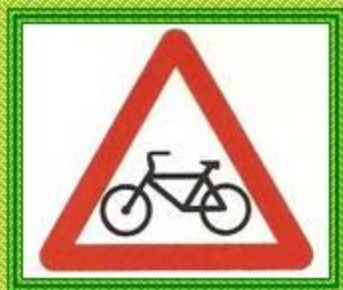
Пересечение с велосипедной дорожкой

Треугольные знаки с красным ободком — предупреждающие.