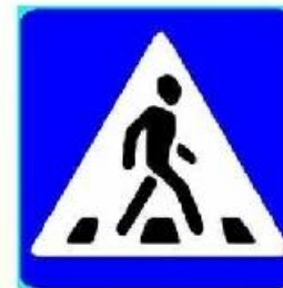
Пешеходный переход (место перехода через дорогу)