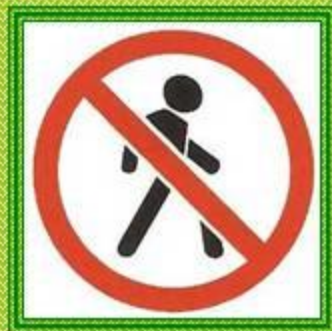
Движение пешеходов запрещено