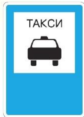
Место остановки такси