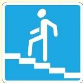
Подземный пешеходный переход (место перехода через дорогу)