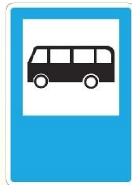
Место остановки автобусов