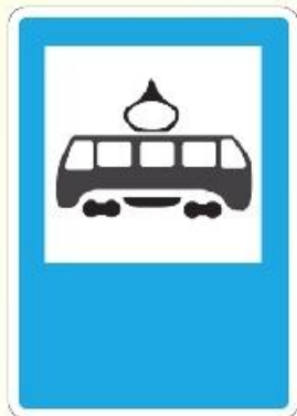
Место остановки трамвая