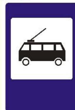
Место остановки троллейбусов