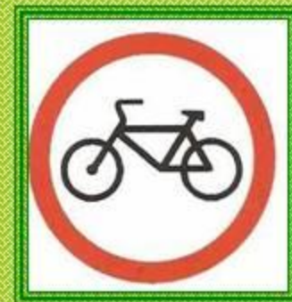
Движение на велосипедах запрещено