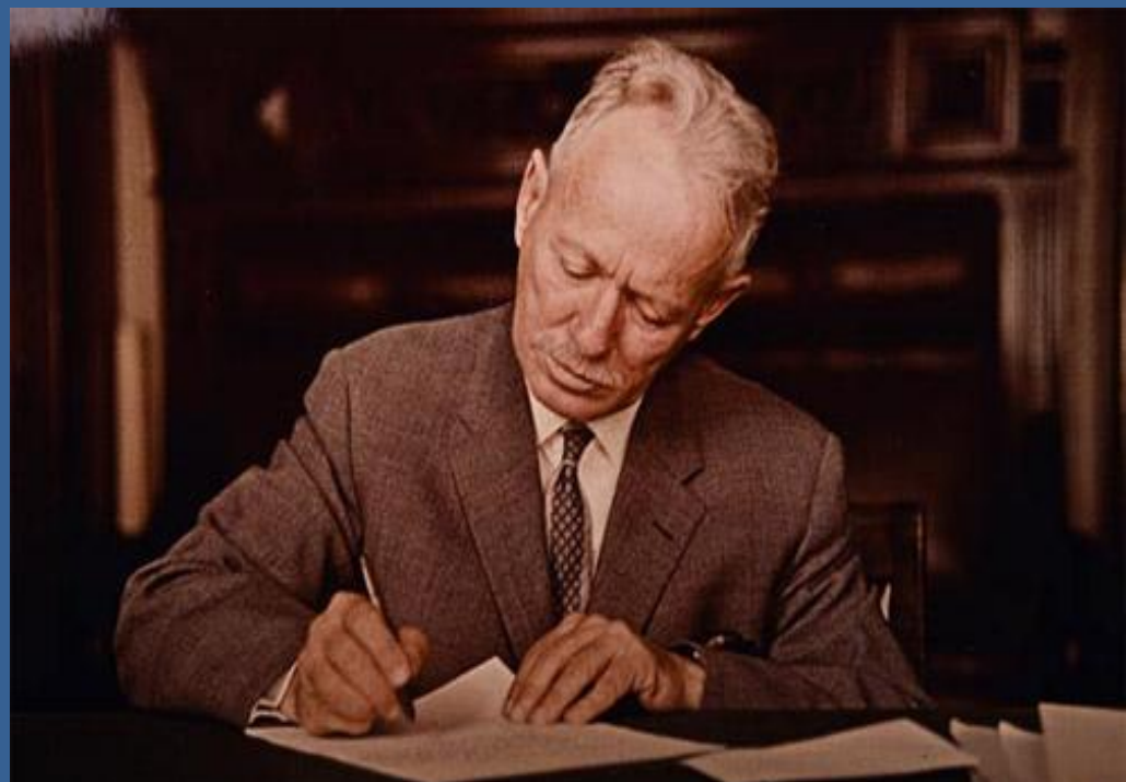
МИХАИЛ АЛЕКСАНДРОВИЧ ШОЛОХОВ