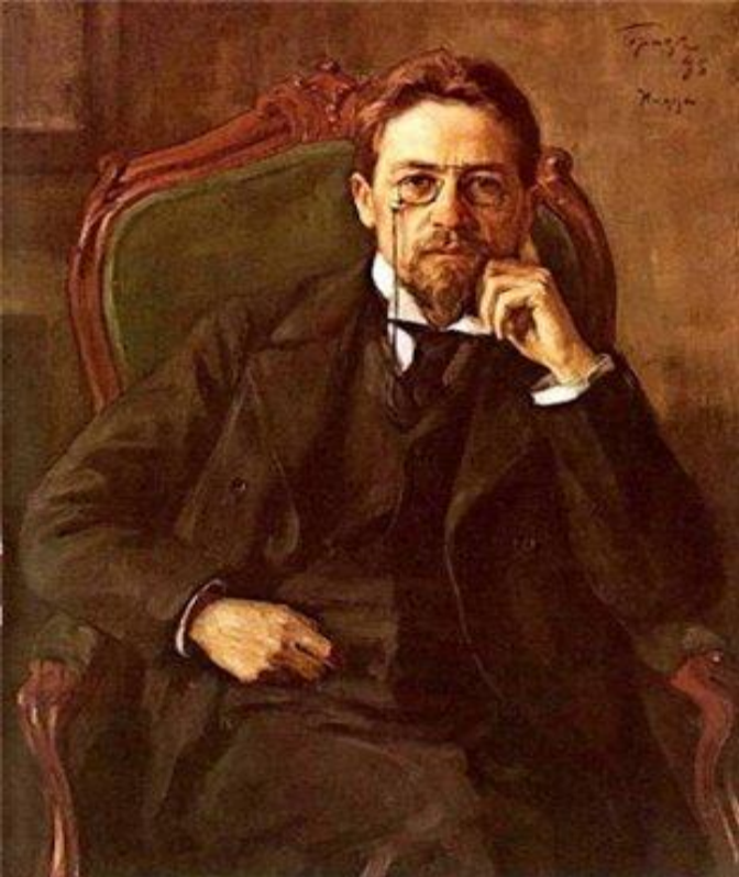
АНТОН ПАВЛОВИЧ ЧЕХОВ