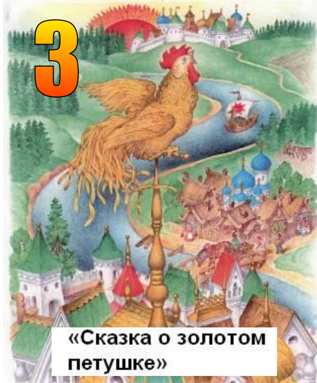
«Сказка о золотом петушке»