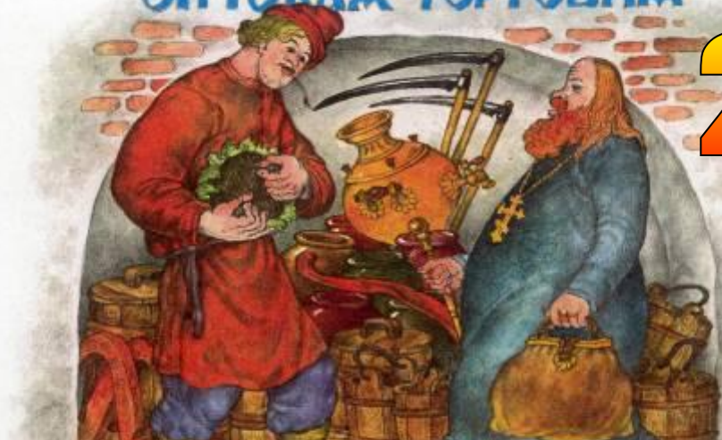
«Сказка о попе и о работнике его Балде»