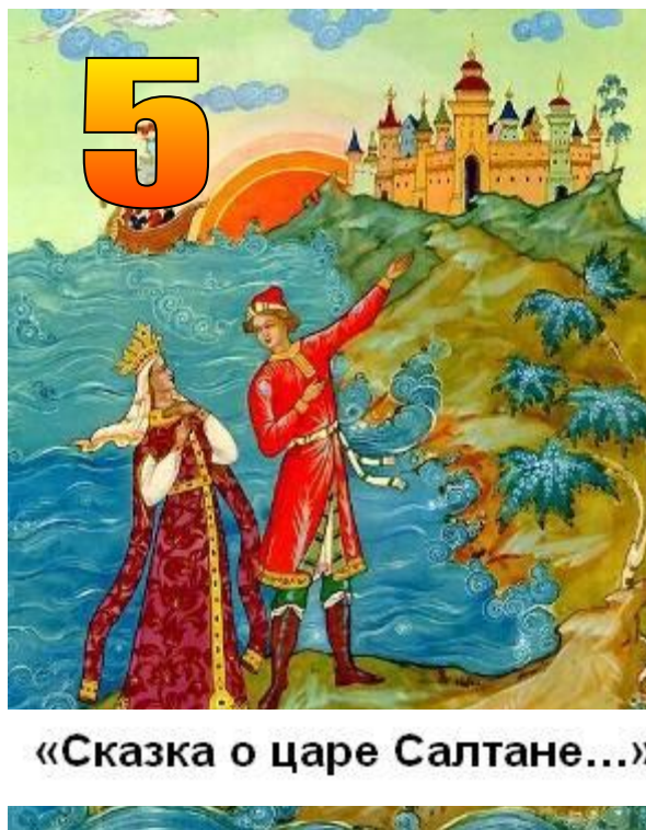
«Сказка о царе Салтане...»