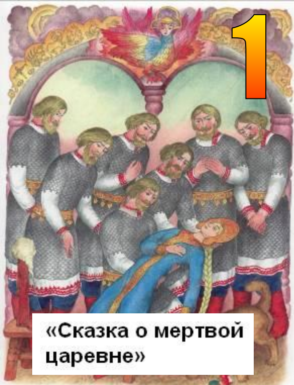
«Сказка о мертвой царевне»