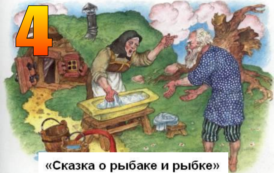
«Сказка о рыбаке и рыбке»