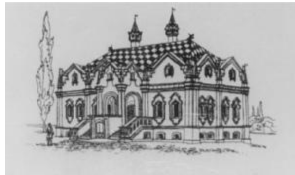
Проект реставрации палат