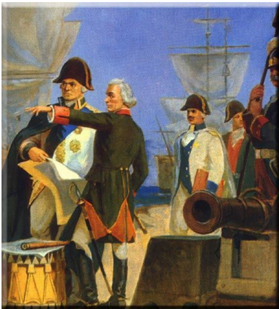
А.В.Суворов и Ф.Ф. Ушаков

В период царствования Екатерины II Россия вела продолжительные войны, в первую очередь за выход к Чёрному морю. В этой войне русскими войсками руководили А. С. Суворов и Ф. Ф. Ушаков.