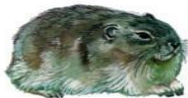
Копытный лемминг (до 14 см)