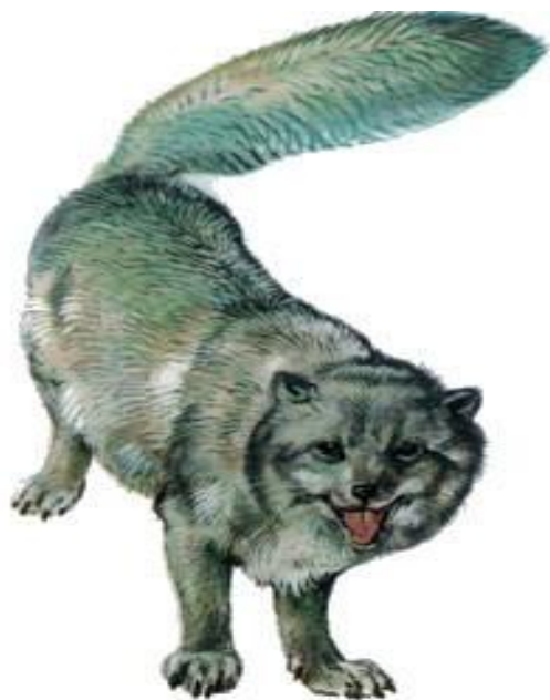
Песец (до 75 см)