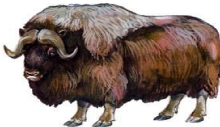
Овцебык (до 2,45 м)