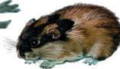
Норвежский лемминг (до 15 см)