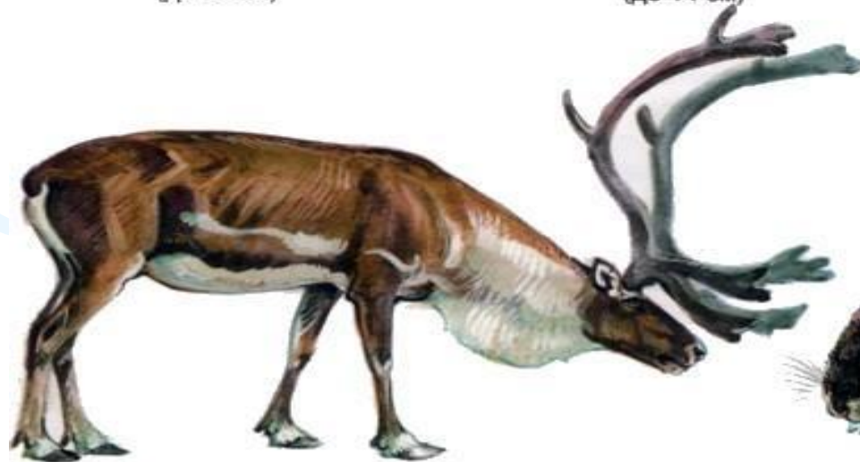
Северный олень (до 2,2 м)