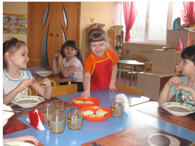
Накрывают на стол