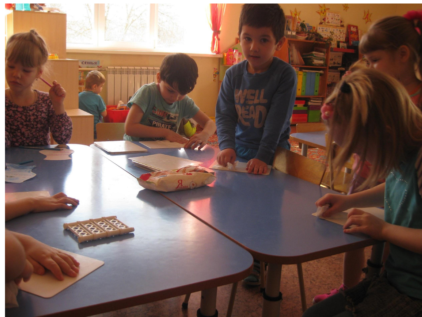
Убирают рабочее место после занятия