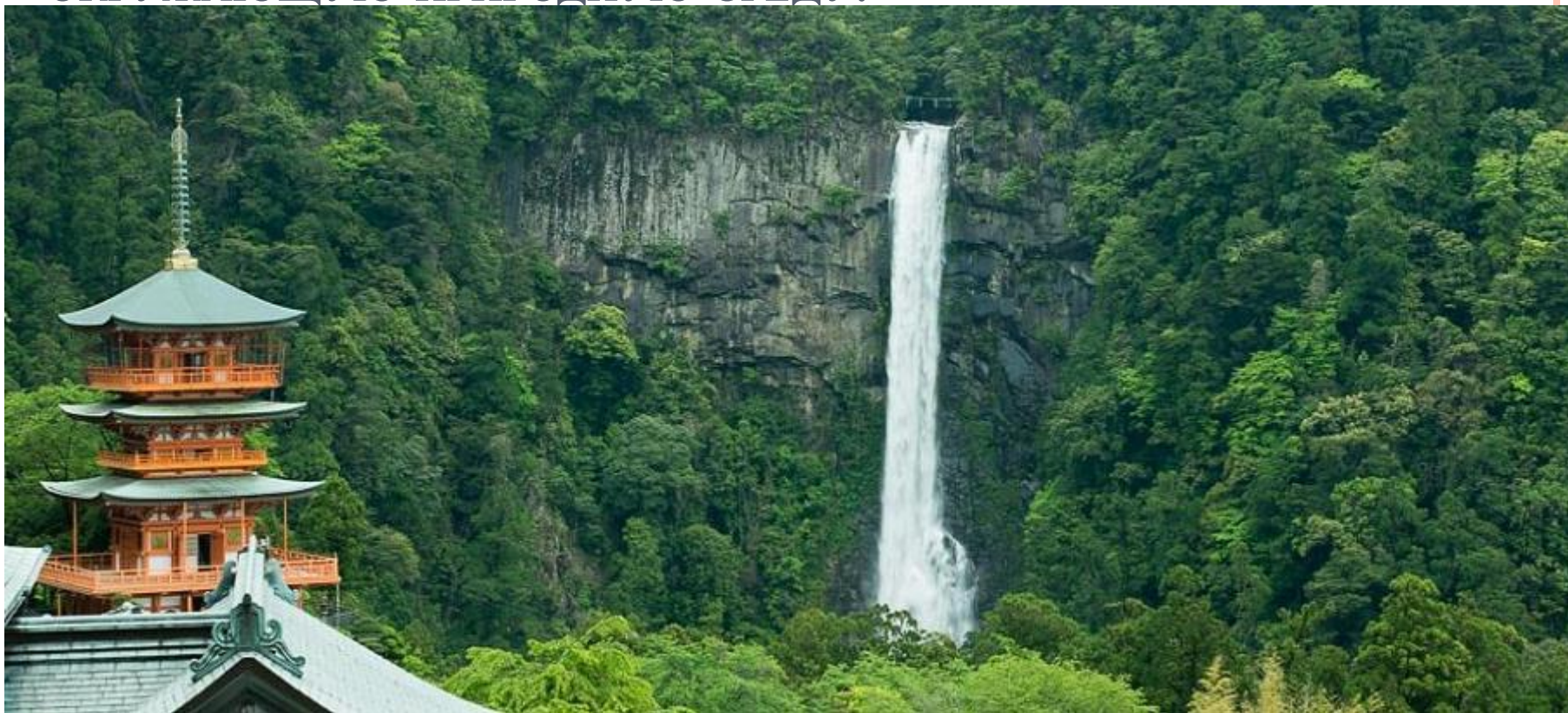
Водопад в национальном парке Ёсино-Кумано

УДИВИТЕЛЬНО, НО ПРИ ТАКОМ НАУЧНО-ТЕХНИЧЕСКОМ ПРОГРЕССЕ ЯПОНЦЫ УМУДРЯЮТСЯ СОХРАНЯТЬ ОКРУЖАЮЩУЮ ПРИРОДНУЮ СРЕДУ.