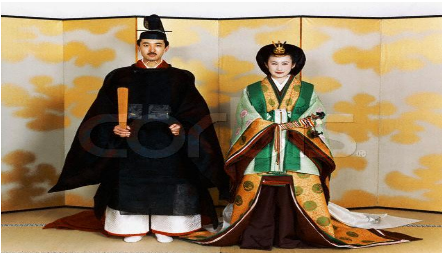
Императорский дворец в Токио

ТОЛЬКО В ЭТОЙ СТРАНЕ И НИГДЕ БОЛЬШЕ МОНАРХА НАЗЫВАЮТ ИМПЕРАТОРОМ, И ДОЛЖНОСТЬ ЭТА ПОЯВИЛАСЬ ОЧЕНЬ ДАВНО, ЕЩЕ В 660 ГОДУ ДО Н. Э.