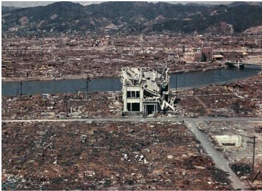
Нагасаки после атомной бомбардировки в 1945 году

Япония сегодня — единственное государство на планете, против которого применено ядерное оружие. Пережив эту страшную трагедию, она всё же смогла воспрянуть, построив с годами сильную экономику.