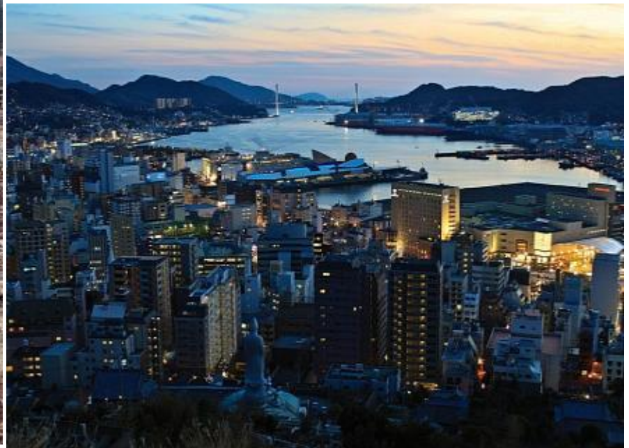
Нагасаки в наши дни