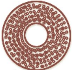
Строение шляпки снизу