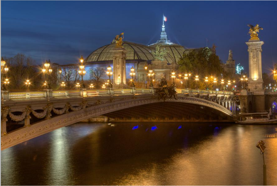
Мост Александра III

По краям моста на высоких колоннах золотые крылатые кони