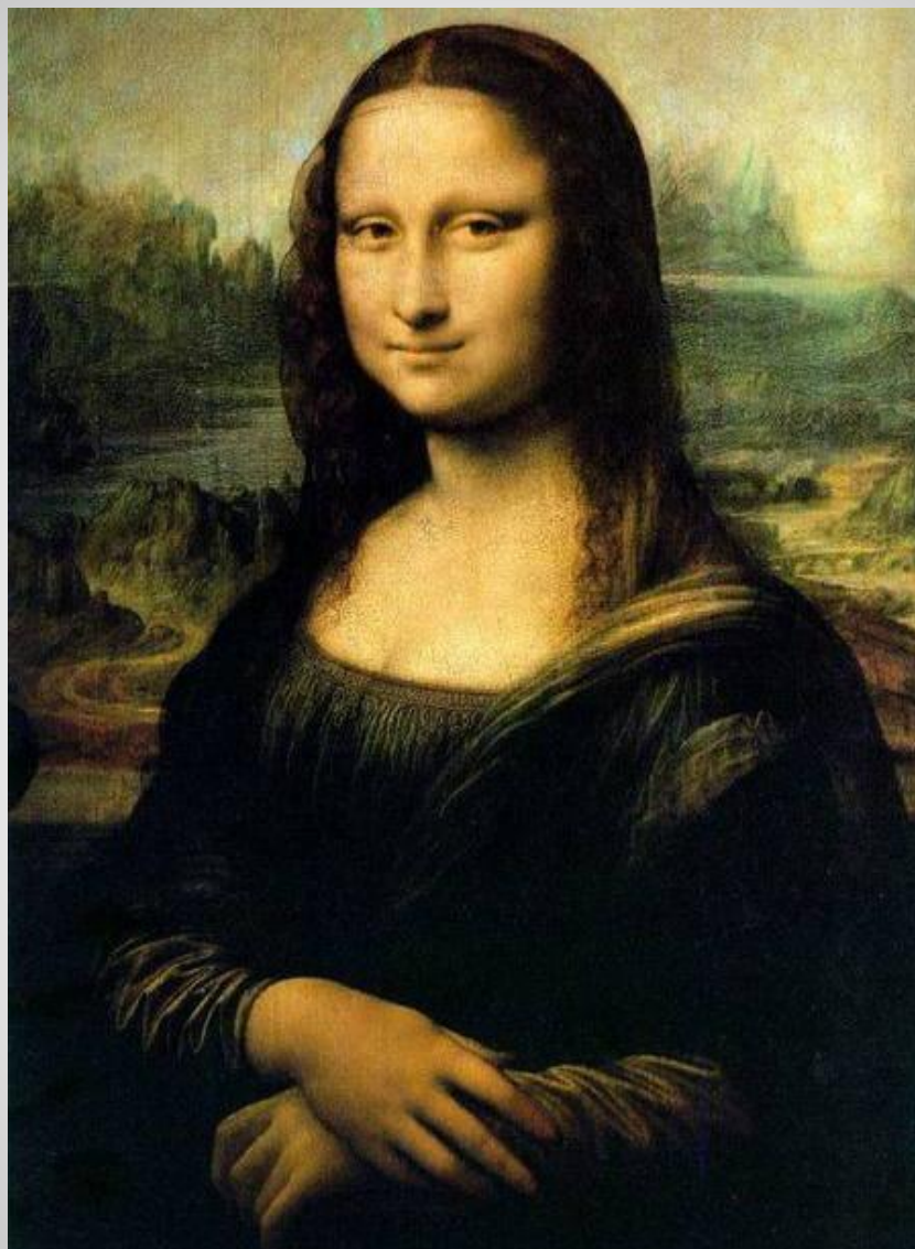
Самая известная в Лувре картина – «Джоконда» великого итальянского художника Леонардо да Винчи