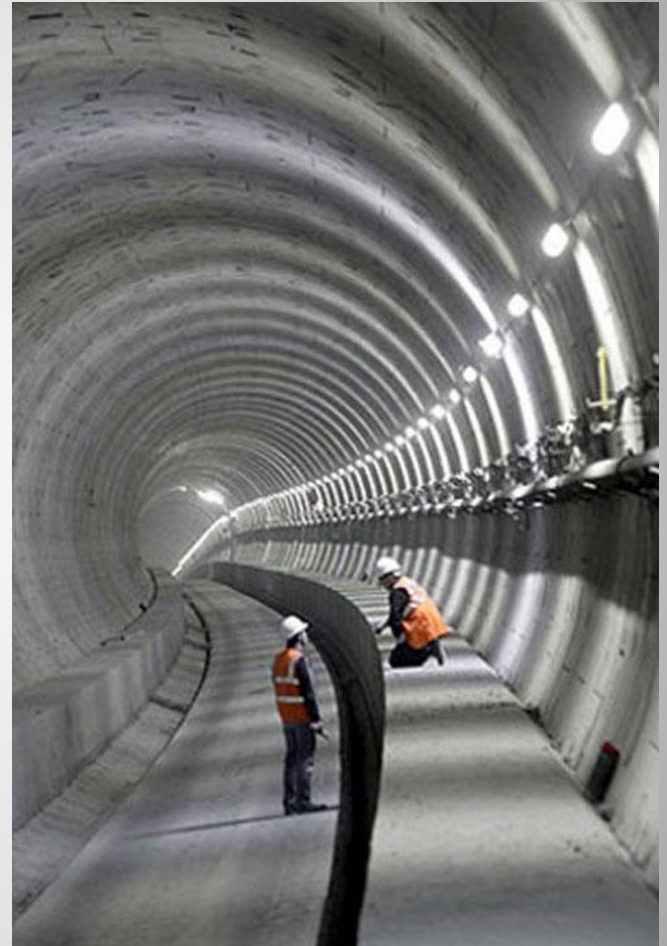
Железнодорожный тоннель под проливом Ла-Манш