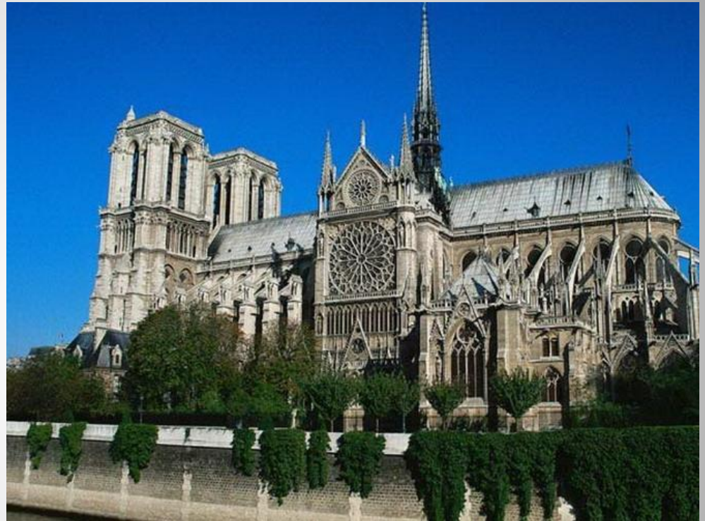
Собор Парижской Богоматери

Собор Парижской Богоматери стоит на острове в центре Парижа