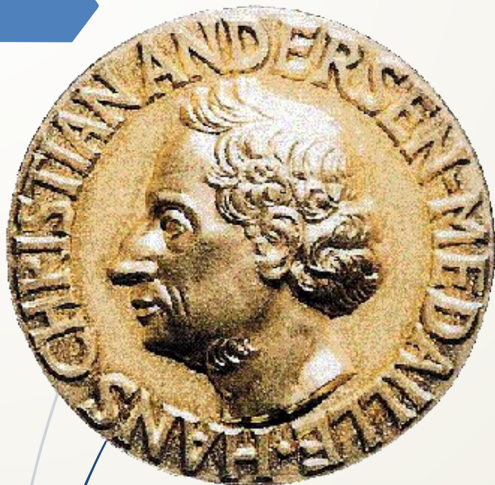
Hans Christian Andersen Medal