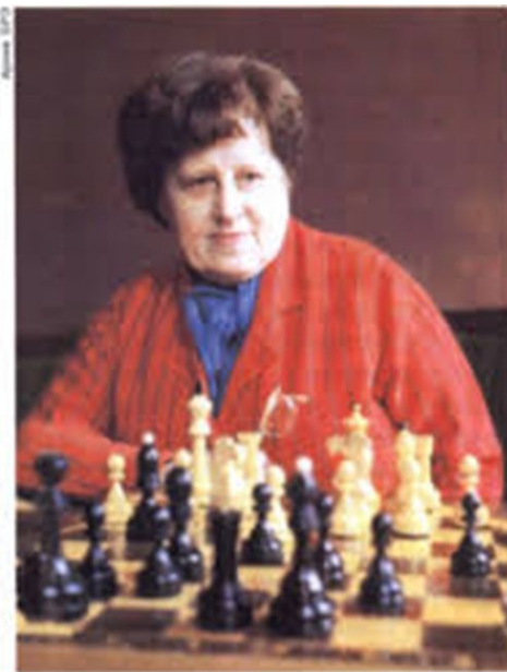
Е. И. Быкова.

Елизавета Быкова (российская шахматистка, чемпионка мира и СССР)