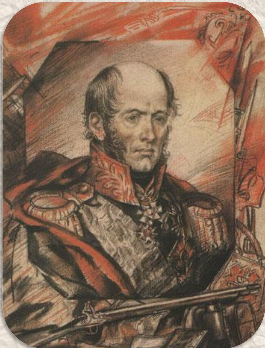
Михаил Богданович Барклай де Толли