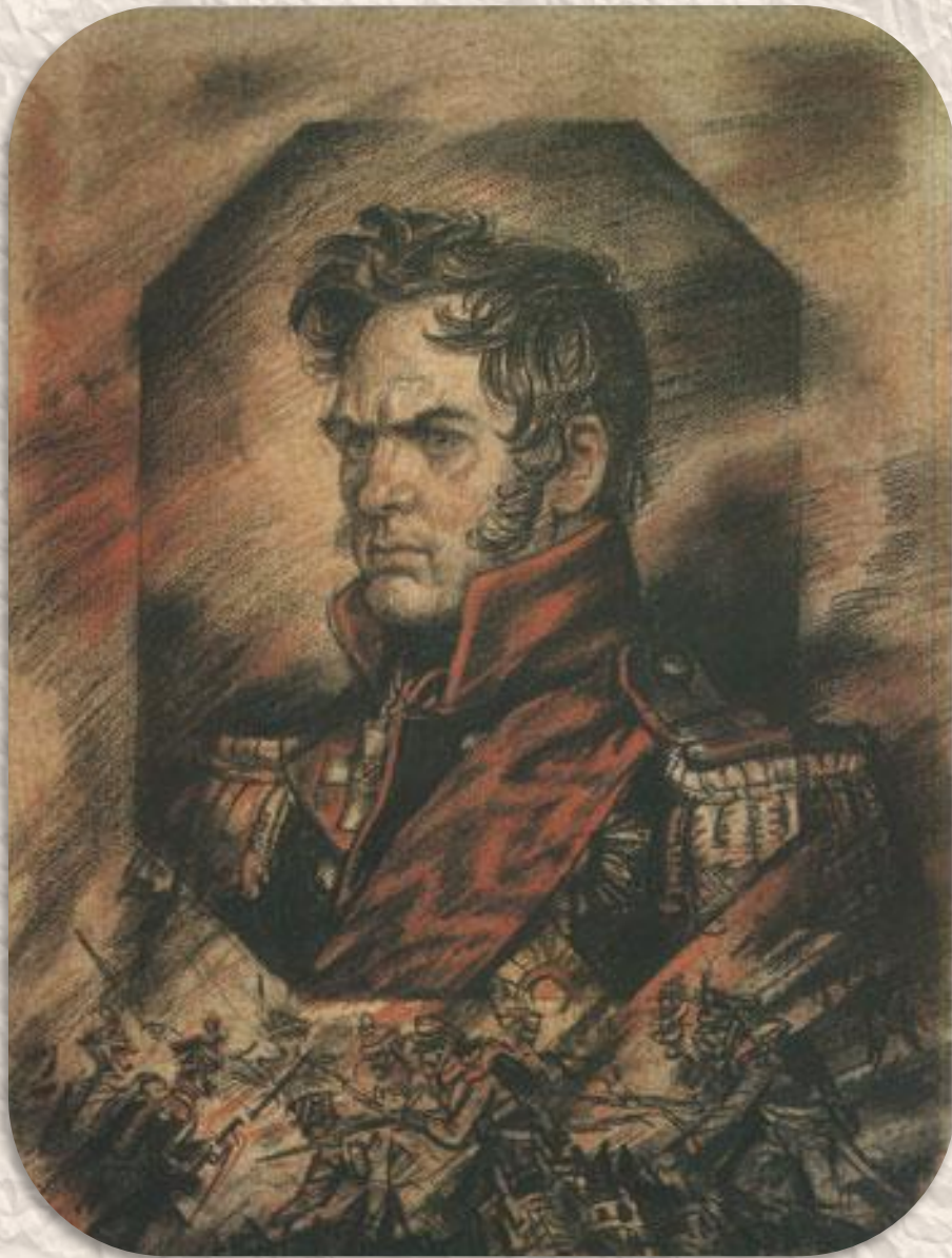
Алексей Петрович Ермолов