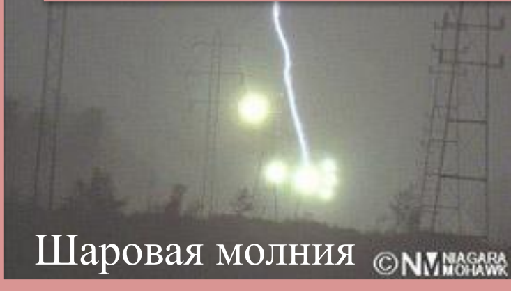
Шаровая молния