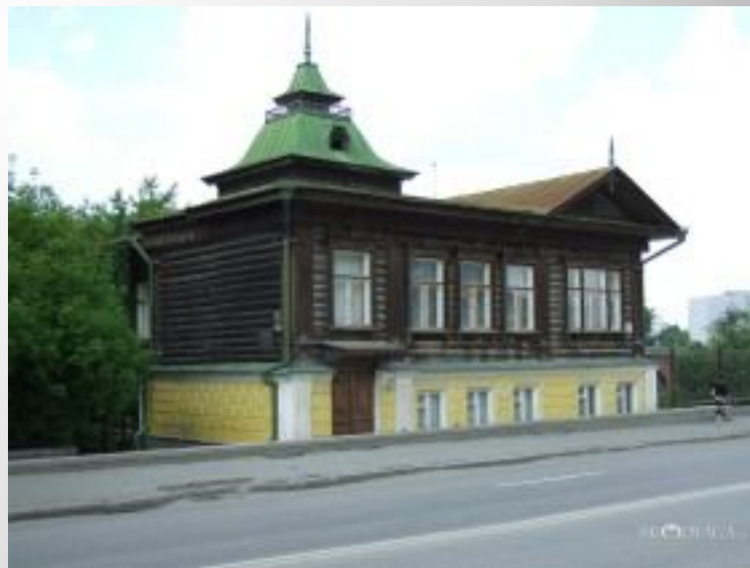
Дом, в котором жил писатель в Екатеринбурге

Летом 1877 вернулся на Урал, к родителям. В следующем году умер отец, и вся тяжесть забот о семье легла на Мамина-Сибиряка. Чтобы дать образование братьям и сестре и суметь заработать, решено было переехать в крупный культурный центр. Был выбран Екатеринбург, где начинается его новая жизнь.