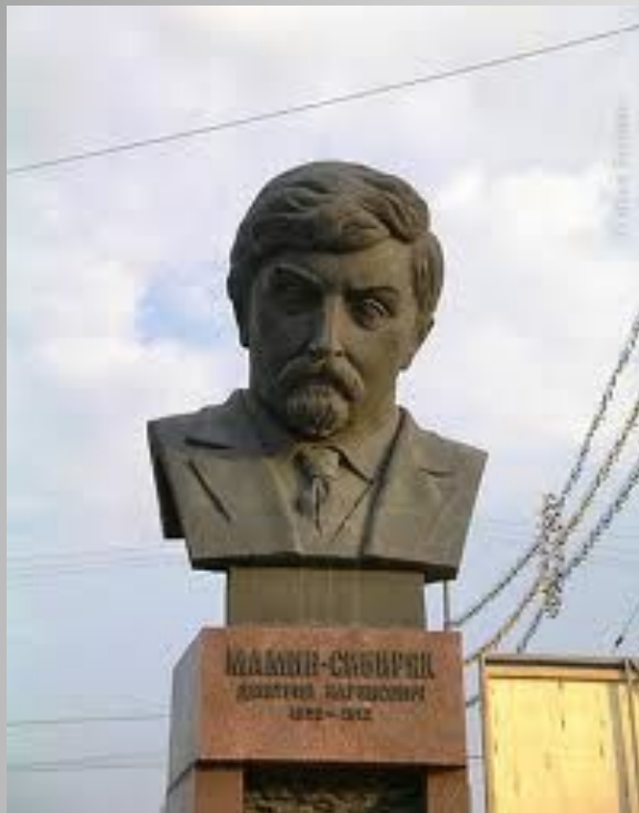
Памятник Д.Н.Мамину-Сибиряку в Екатеринбурге.