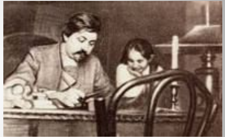
С дочкой Алёнушкой

К детской литературе Дмитрий Наркисович относился очень серьезно. Обращаясь к писателям, своим современникам, Мамин-Сибиряк призывал их правдиво рассказывать детям о жизни и труде народа. "Детская книга - это весенний солнечный луч, который заставляет пробуждаться дремлющие силы детской души и вызывает рост брошенных на эту благодатную почву семян".