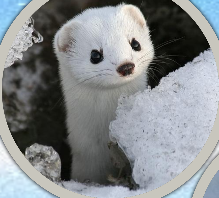
Ласка самый маленький хищный зверёк