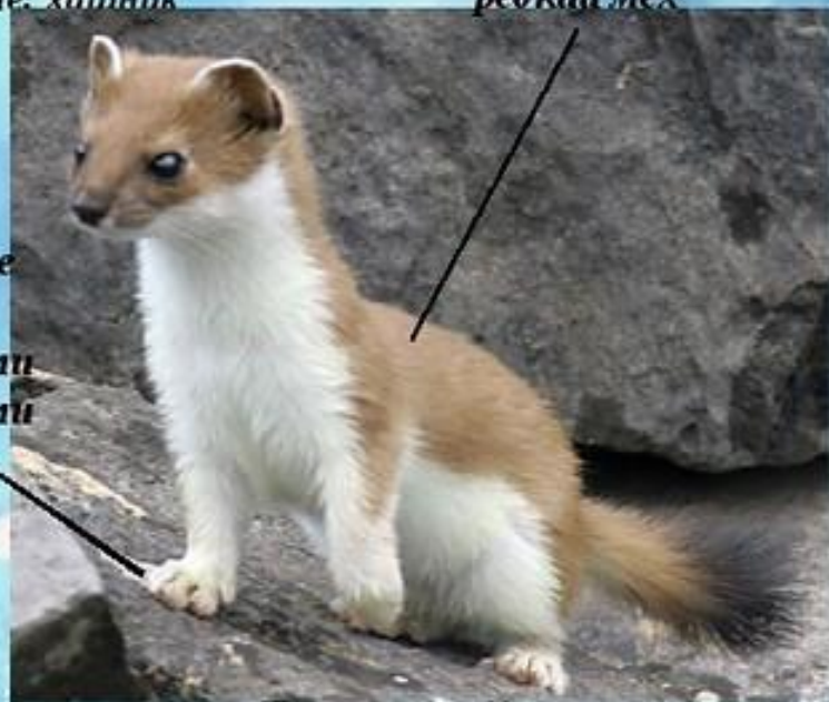
Горноста́й в летнем наряде

К зиме зверёк линяет, и у него вырастает густой белоснежный мех. Но кончик хвоста остаётся чёрным.