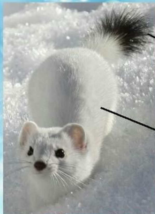
Горноста́й в зимнем наряде