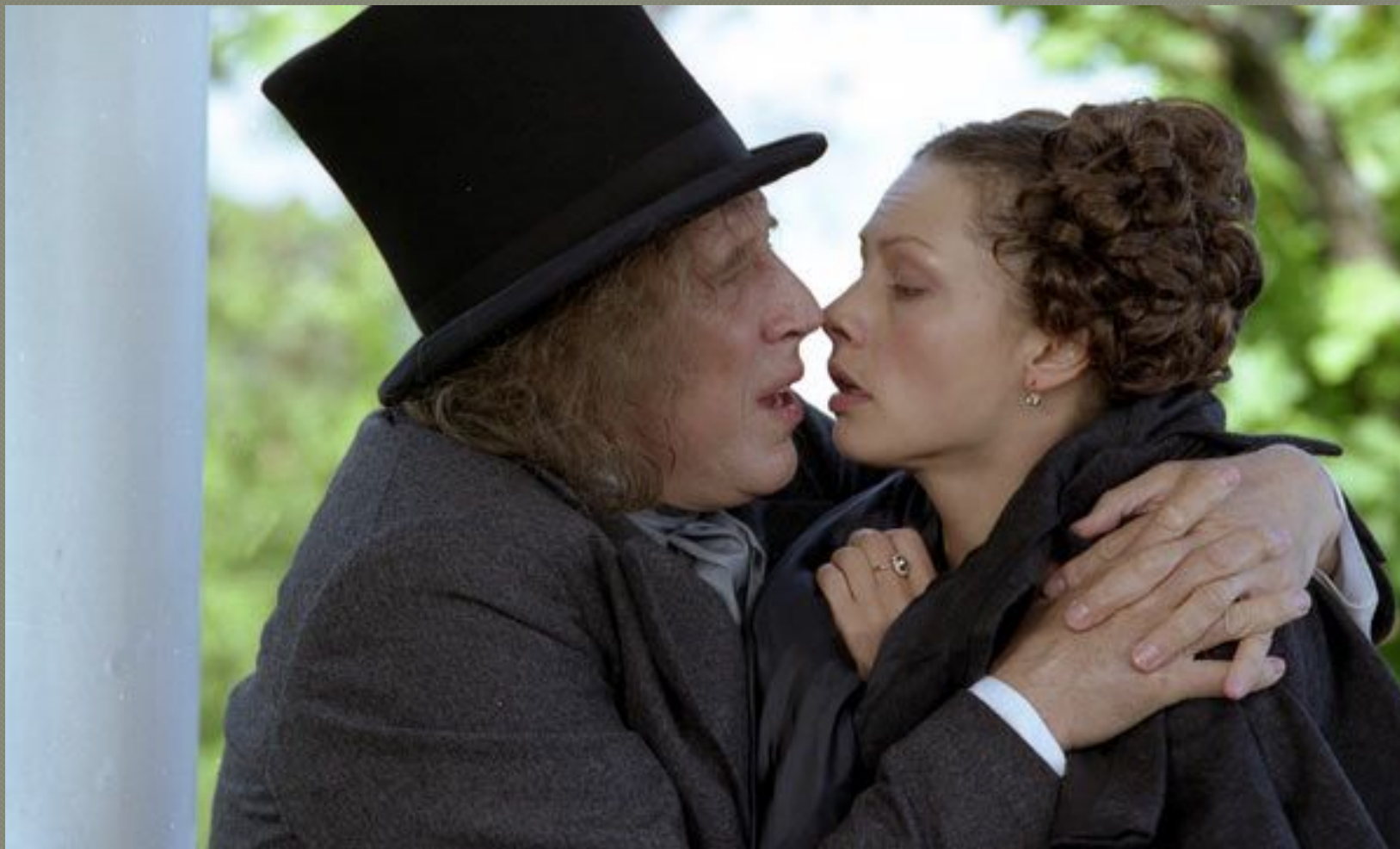
Сергей Мигицко и Алена Бабенко в фильме "Андерсен. Жизнь без любви"