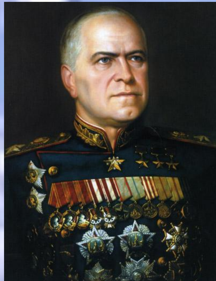
Жуков Георгий Константинович Маршал, герой Великой Отечественной войны 1941-1945г.г.

Прославленный русский полководец. Герой Отечественной войны 1812года.