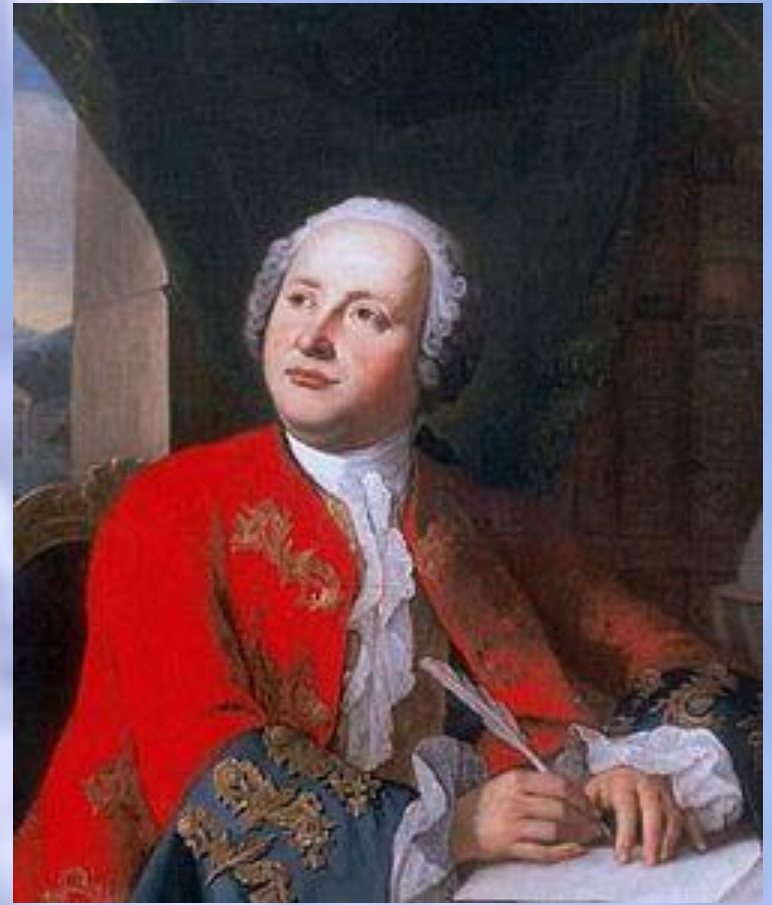
Ломоносов Михаил Васильевич великий российский учёный