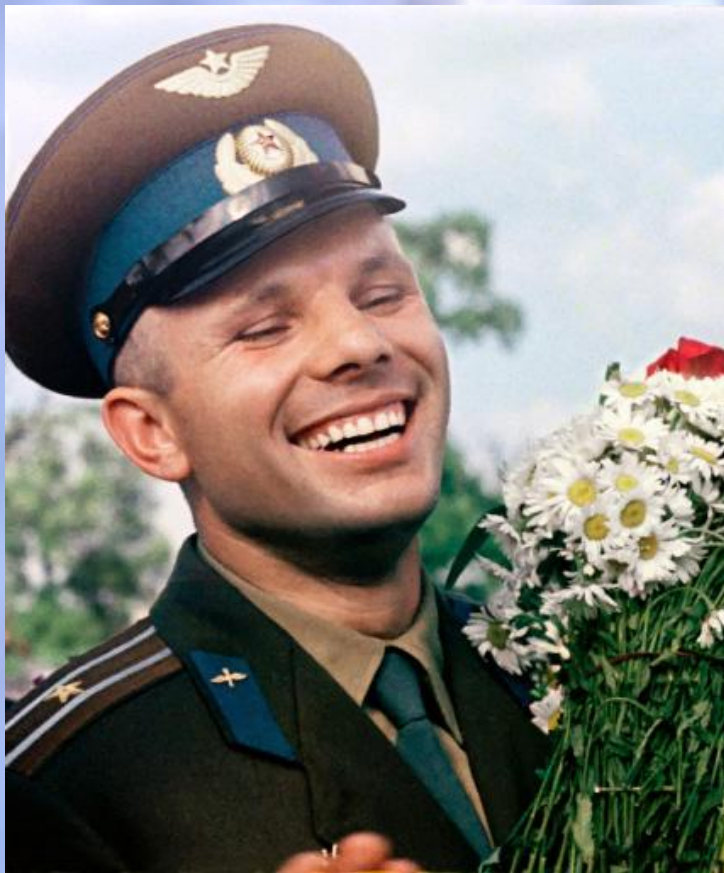
Гагарин Юрий Алексеевич первый космонавт