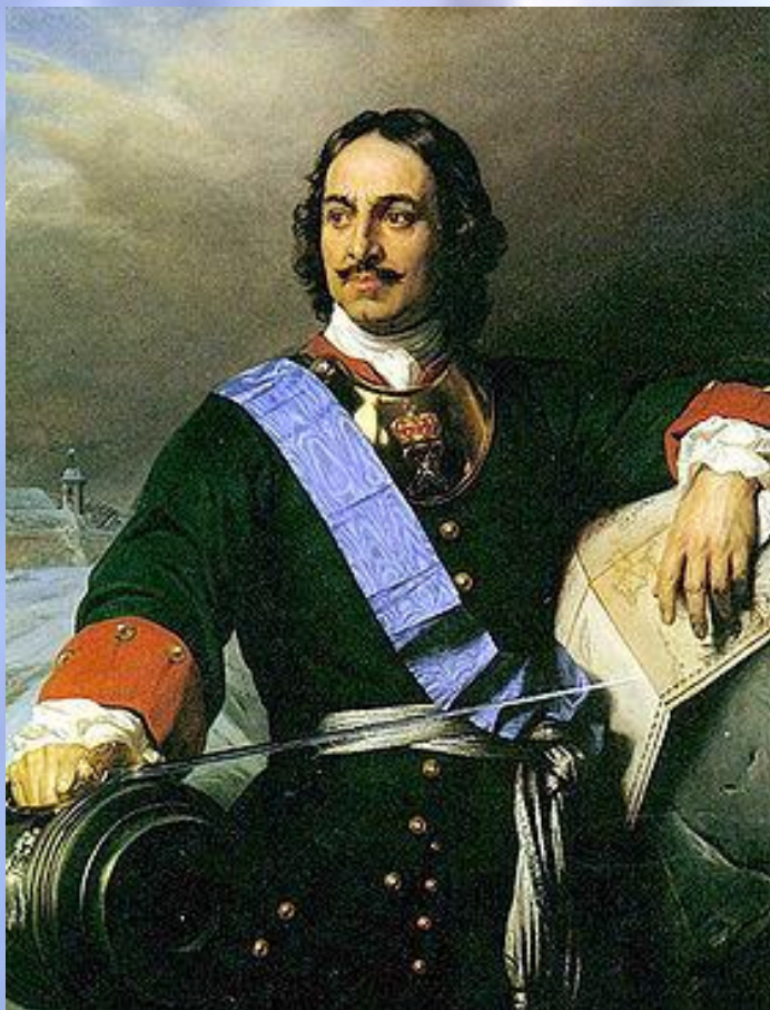
Пётр Первый Император России