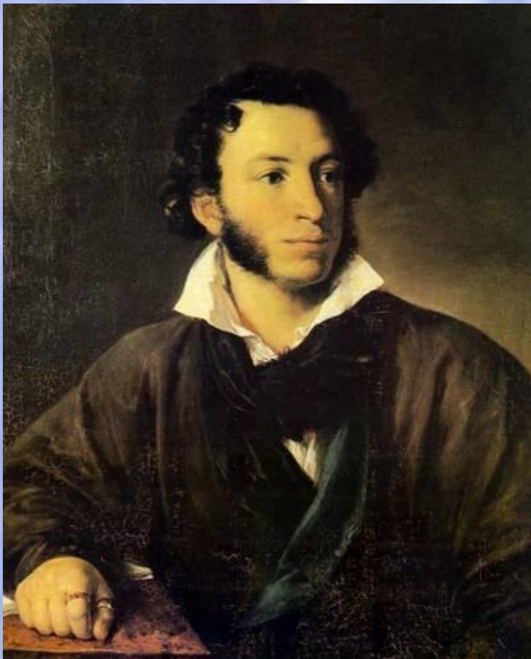
Пушкин Александр Сергеевич поэт