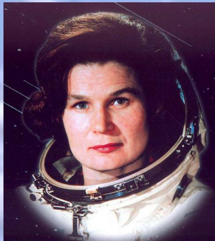
Терешкова Валентина Владимировна первая женщина – космонавт