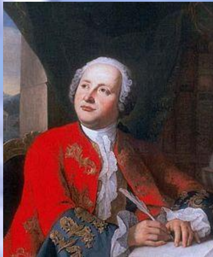
Ломоносов Михаил Васильевич великий российский учёный