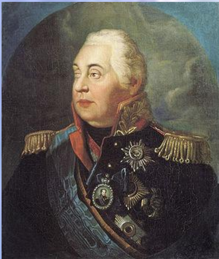
Кутузов Михаил Илларионович (1745—1813)

Прославленный русский полководец. Герой Отечественной войны 1812года.