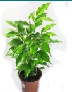
Фигус Бенжамина Голд Моник