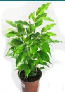
Фигус Бенжамина Голд Моник