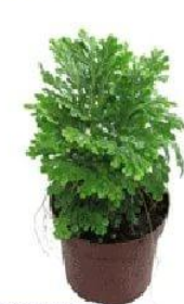
Селагинелла Мартенси Йори