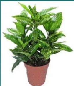
Аукуба Японика Вариегата