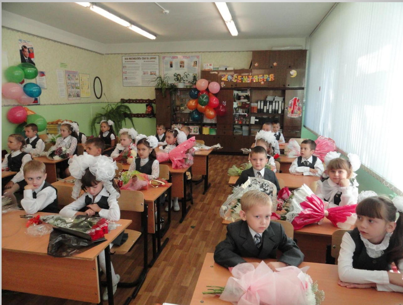
Ученики 2 класса «А»