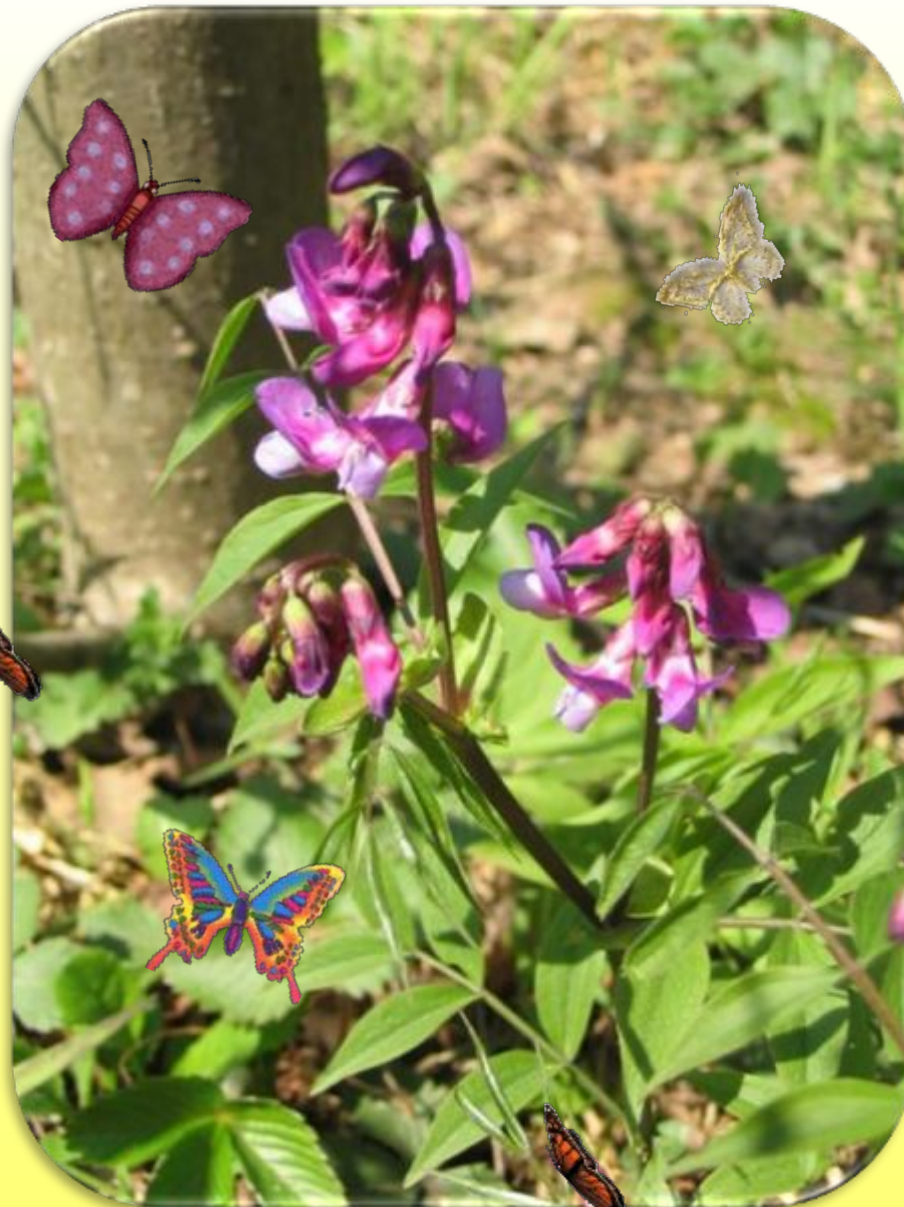
Сочевичник (чина весенняя)