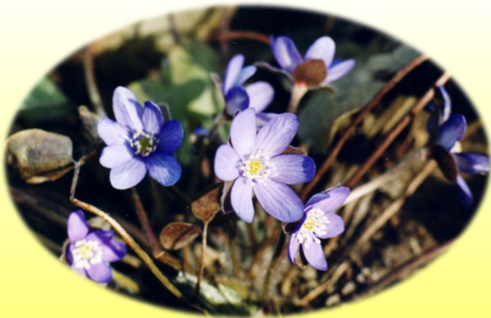
Печёночница благородная или перелеска