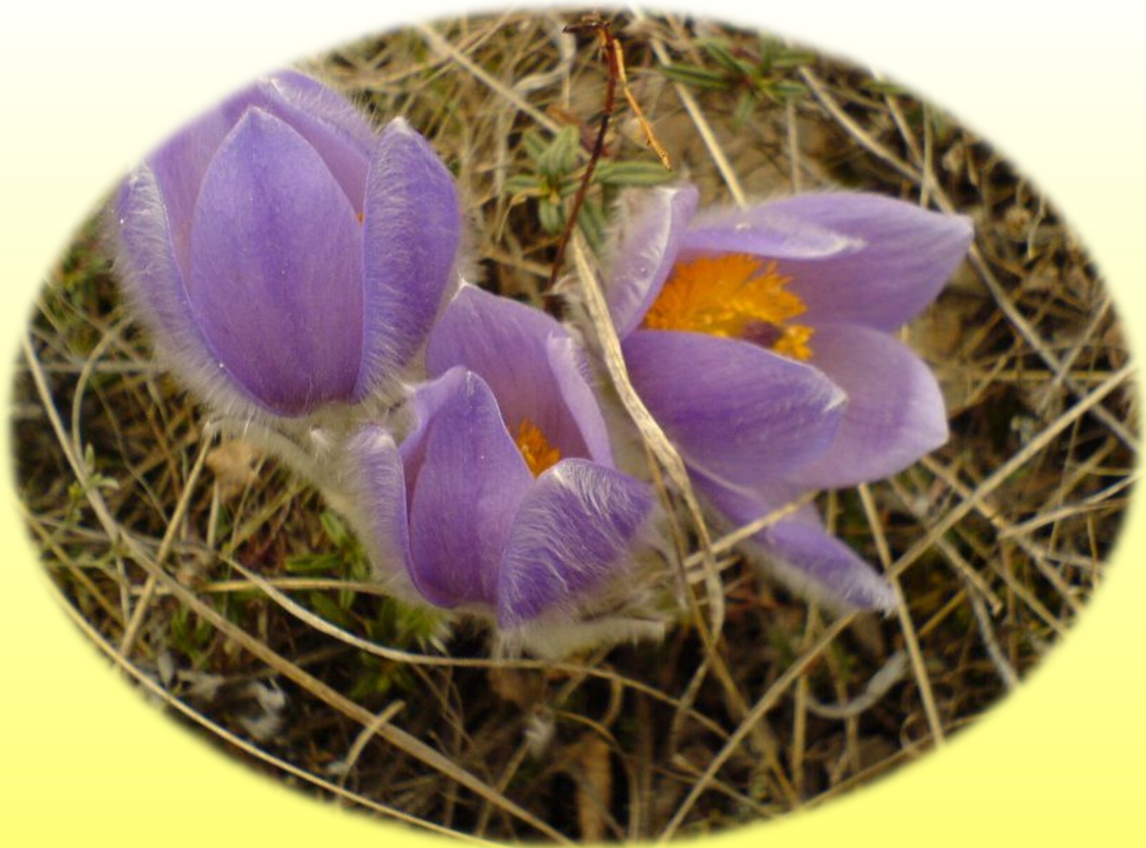
Прострел раскрытый (сон – трава)