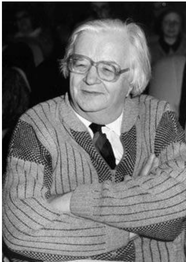
Валентин Дмитриевич Берестов