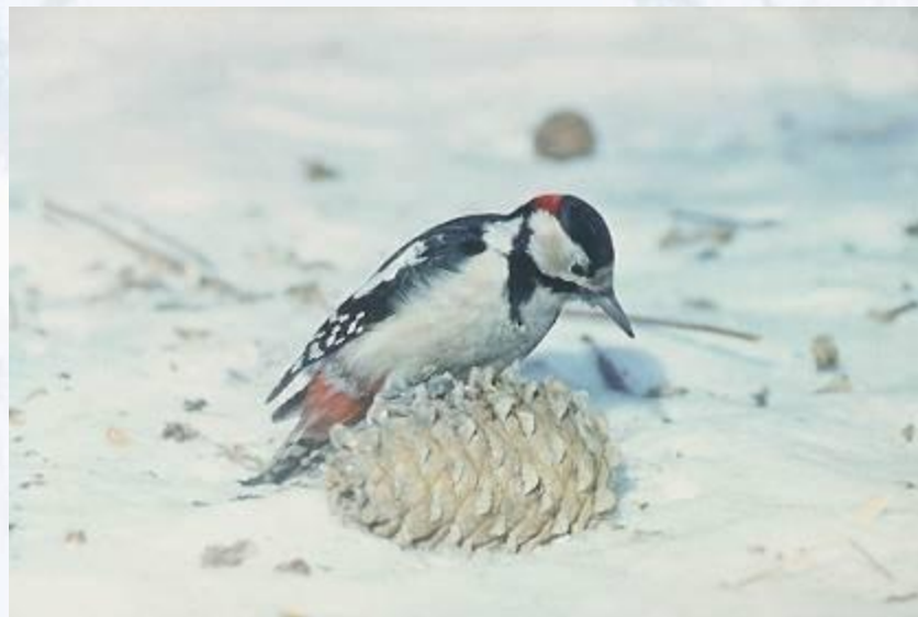
Большой пёстрый дятел