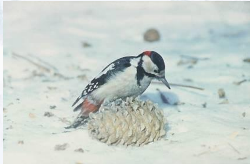
Большой пёстрый дятел