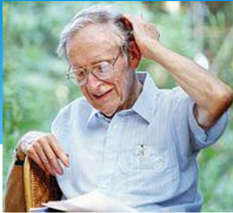
Юджин Одум (1913—2002).