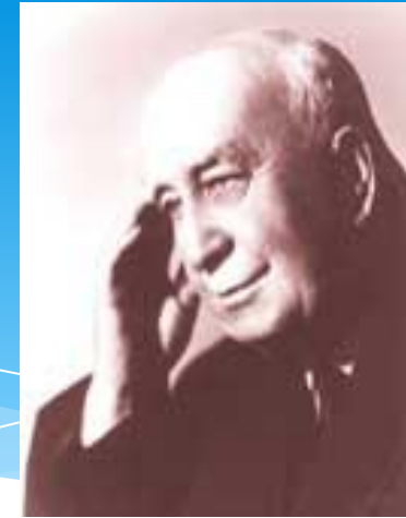
Владимир Николаевич Сукачёв (1880—1967). Автор термина биогеоценоз

Понятие экосистемы ввел английский учёный А. Тенсли