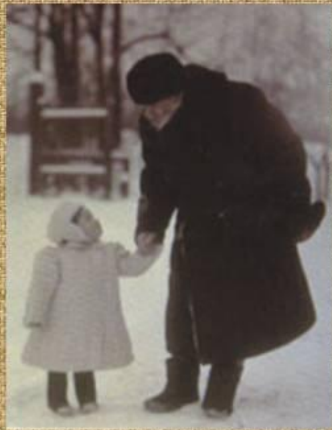
Л.Н. Толстой с внучкой Танечкой Сухотиной . 1908 г. Ясная Поляна.