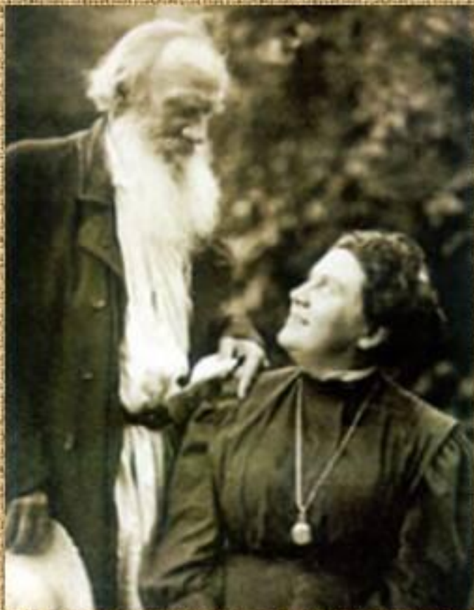
Л.Н. Толстой с А.Л. Толстой. 1908 г. Ясная Поляна. Фотография В.Г. Черткова